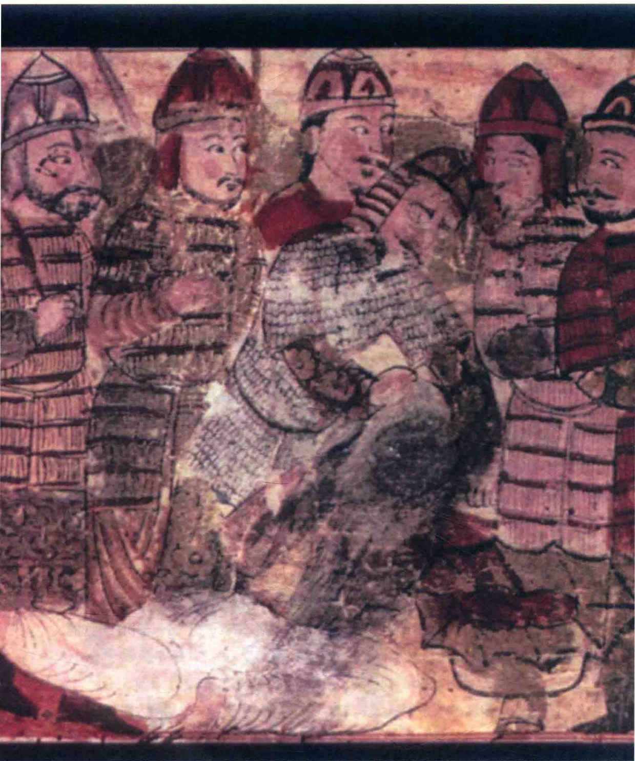
◎ 俄罗斯壁画中的蒙古骑兵形象