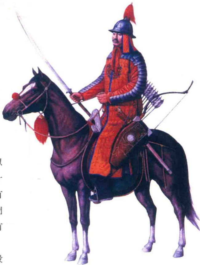
明代御林军复原图

由此看来，如果皇帝亲征，明军投入五十万人似乎也不是没有可能。但是以上数据都是额定兵员数，不等于实际