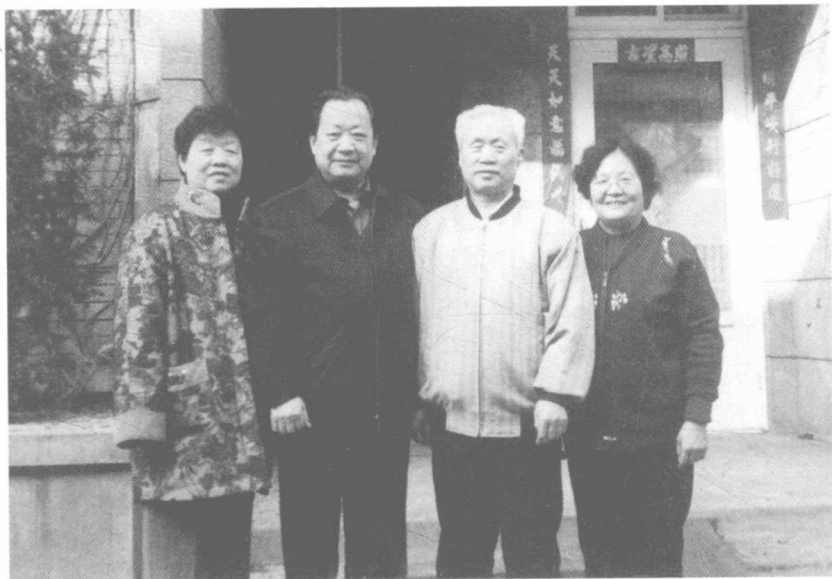
2009年与弟 和妯娌在门 廊下