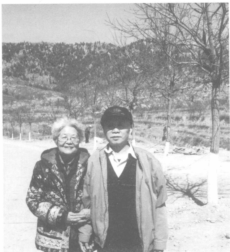
2014年3月13日， 与老伴在万荣县孤 山脚下考察古人类 遗址