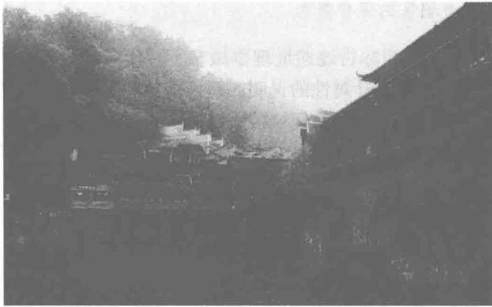
图 1-1 凤凰古城

地质、地貌、水文、气候及土壤等因素组成了历史城区的自然环境，自然环境作为历史城区存在的地理背景，同时也是历史城区环境的重要组成部分。自然环境的不同主要是由不同的地域景观所引起的，不同的空间特征主要是由不同的区域地貌和气候条件所产生的不同的建筑风貌和空间格局引起的。例如：湘西独特的山水地貌，造就了凤凰古城山间暮鼓晨钟兼鸣，河畔吊脚楼轻烟袅袅，前后错落，似断似连的天际轮廓线（图 1-1）。