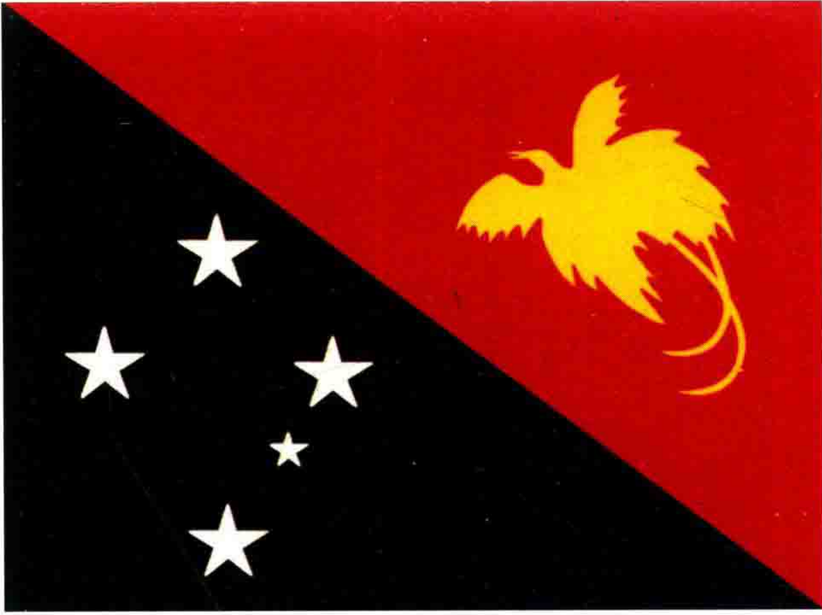
巴布亚新几内亚国旗