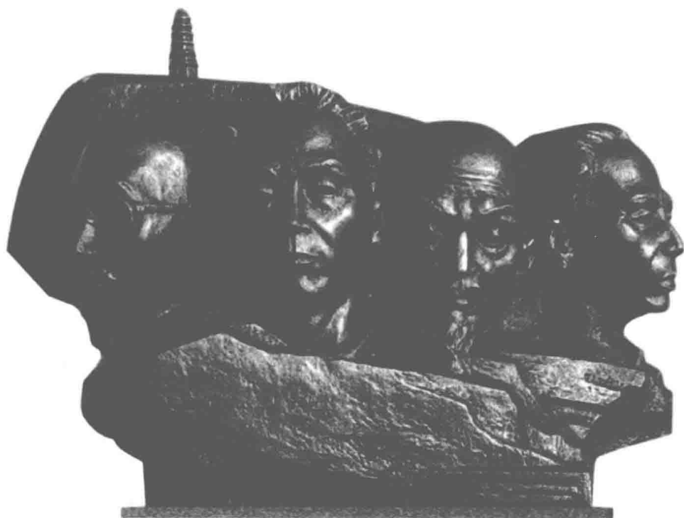
新疆四大名医铜像