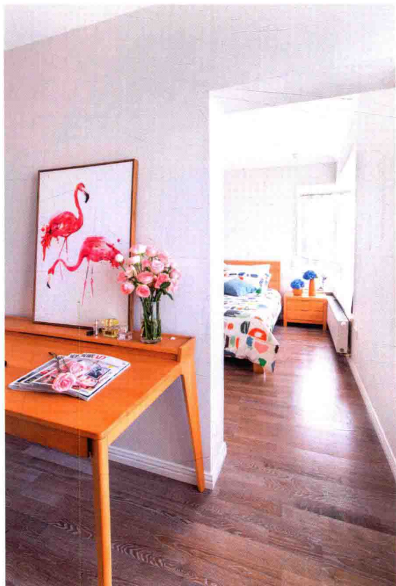
画 北欧火烈鸟装饰画，火烈鸟象征忠贞不渝的爱情。把它放在这里体现了设计者的情怀，也点亮了整个空间。 材质：木框 价格：150 ~ 300 元