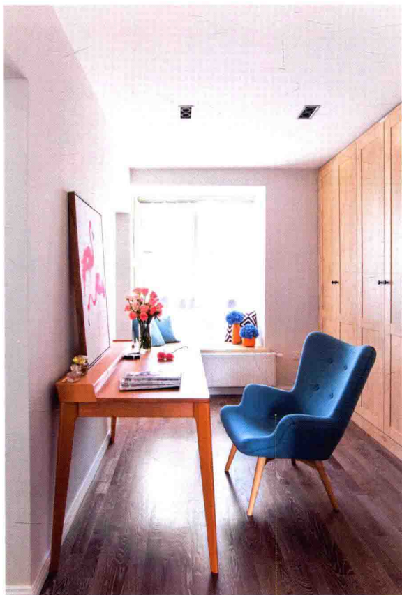
书椅 北欧高背休闲沙发椅，布艺实木靠椅。椅子设计简洁、直接，展现了北欧风格独特的美感。 材质：布艺、实木 价格：500 ~ 2000 元