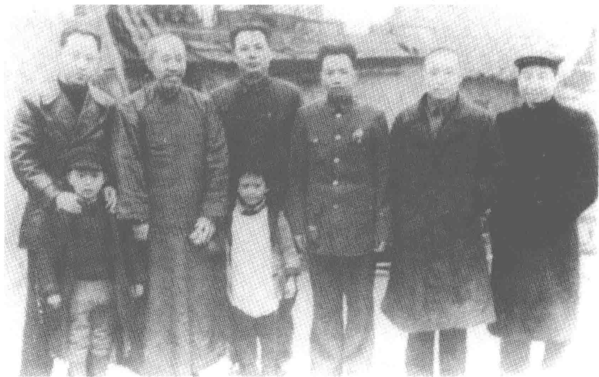
1939年春，南方局部分常委及部门负责人在重庆办事处机房街70号驻地合影。左起：外事组组长王炳南，南方局常委董必武、叶剑英，办事处处长钱之光，南方局常委何克全、吴克坚。