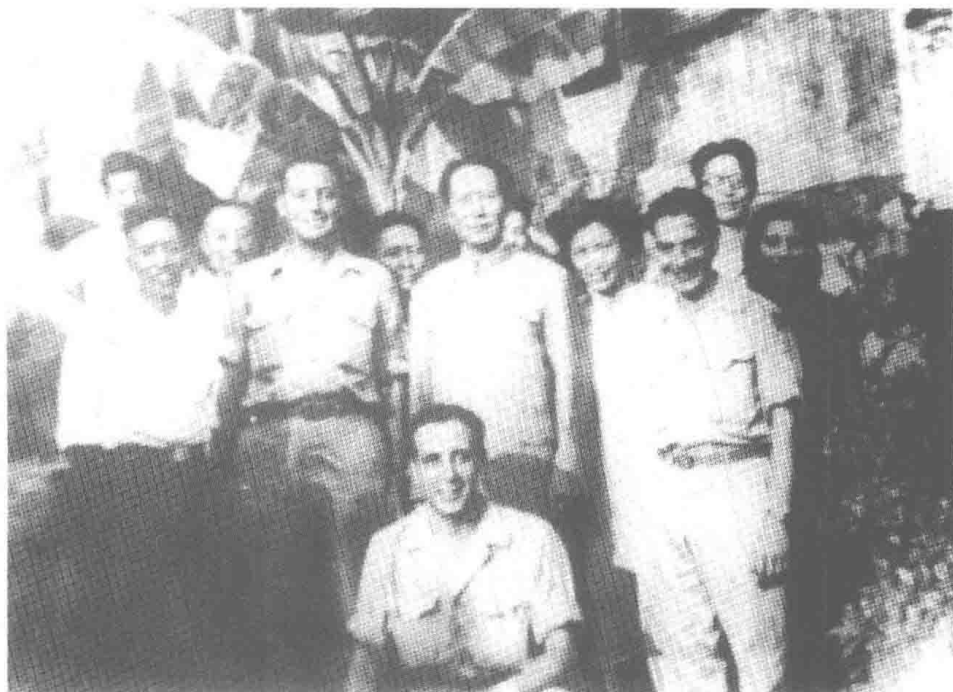
1945年9月16日，毛泽东在重庆办事处红岩嘴驻地会见美国驻华14航空队总部的3位士兵并合影。前蹲者为杰克·埃德尔曼，前排左起：钱之光、爱德华·贝尔、毛泽东、霍华德·海曼；后排为办事处工作人员。