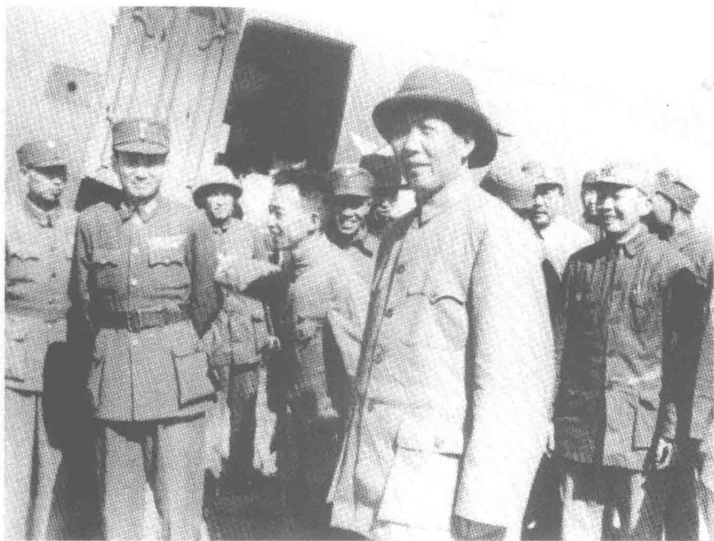
1945年10月11日，毛泽东与国民党谈判后离开重庆时在机场留影。第二排左起为张治中、钱之光。