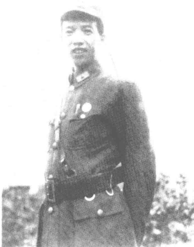
八路军驻重庆办事处处长钱之光。