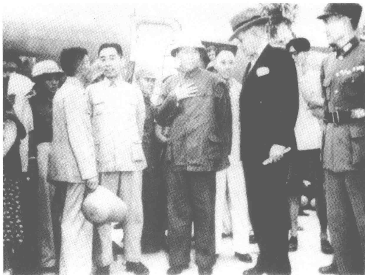
1945年8月28日，毛泽东抵达重庆同国民党谈判。到机场迎接的有国民党军政要员、民主人士、八路军驻重庆办事处人员和中外记者近百人。前排从左至右为：钱之光、周恩来、毛泽东、赫尔利、张治中。