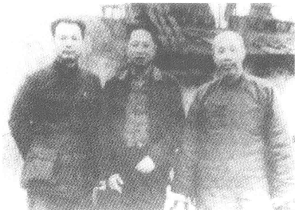
1939年3月，董必武（右）、叶剑英（左）、叶挺（中）在重庆办事处机房街70号驻地合影。