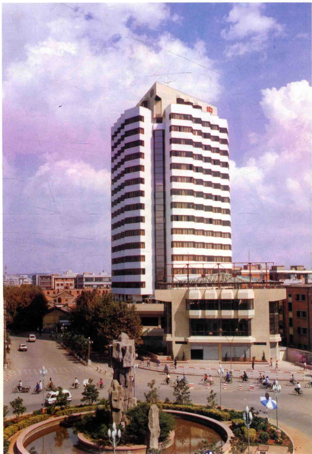
云南省烟草公司办公大楼，地址在昆明市北京路塘子巷口