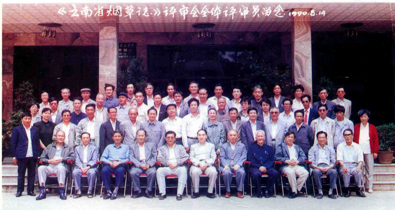
《云南省烟草志》参加评审人员合影