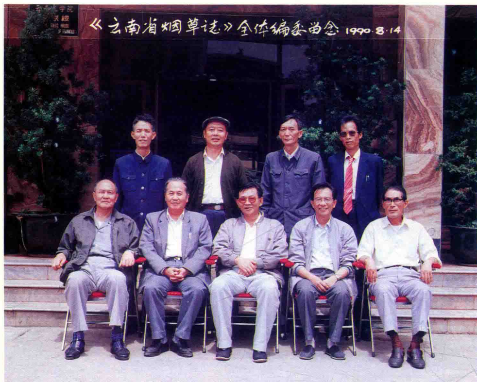
《云南省烟草志》编纂领导小组全体成员合影