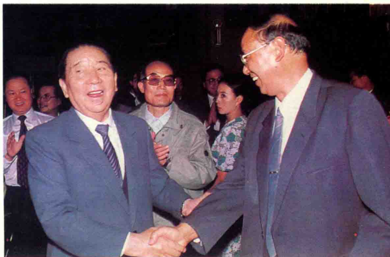
上 国务院副总理朱镕基视察玉溪卷烟厂