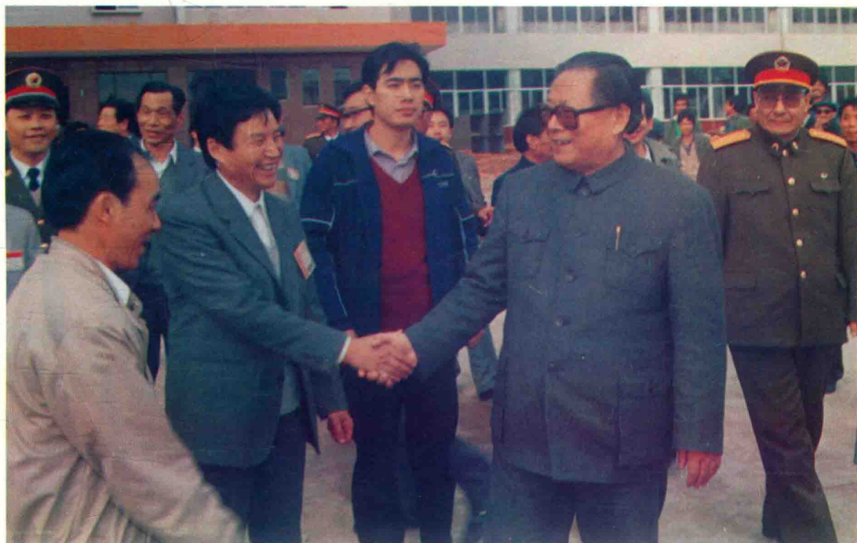
上 中共中央总书记江泽民在中共云南省委书记普朝柱的陪同下视察昆明卷烟厂 下 江泽民总书记同昆明卷烟厂领导陈传柏、张水长等亲切握手