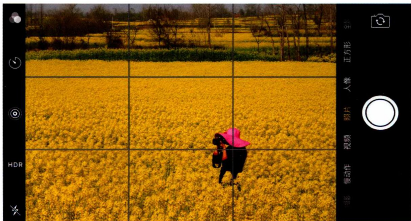
▲ 手机网格线截屏，主体在交叉点位置上

这种简化了的黄金分割构图方法也常被称为“井”字形构图或九宫格构图。使用手机拍摄照片时，由于手机都有网格线功能，这可以让我们更加方便、精准地完成黄金分割构图拍摄。