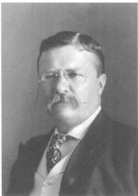
西奥多·罗斯福,1901—1909年担任美国总统。 在进步运动时期起了主要的推动作用