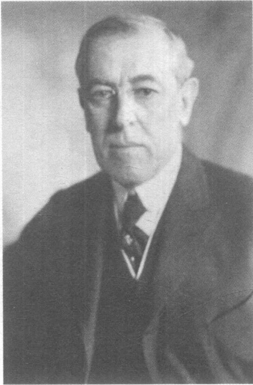
伍德罗·威尔逊,1913—1921年担任总统。 在进步运动时期起了主要的推动作用