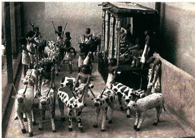
古埃及人驱赶牲畜的雕塑

尼罗河的上游，有两条主要支流——白尼罗河和青尼罗河。白尼罗河源于维多利亚湖以西终年多雨的群山之间，流经今天的卢旺达、布隆迪、坦桑尼亚、肯尼亚、乌干达和扎伊尔，最后到达苏丹。青尼罗河则发源于埃塞俄比亚西北部高原上的塔纳湖，流经今天的埃塞俄比亚和苏丹。两河在苏丹首都喀土穆汇合，合流点以下的河段就称为“尼罗河”。如果是洪水期，青、白两种截然不同的水流汇合，会形成青白分明的独特景观。汇合后的尼罗河主流，水量大增，流量更加富于变化。