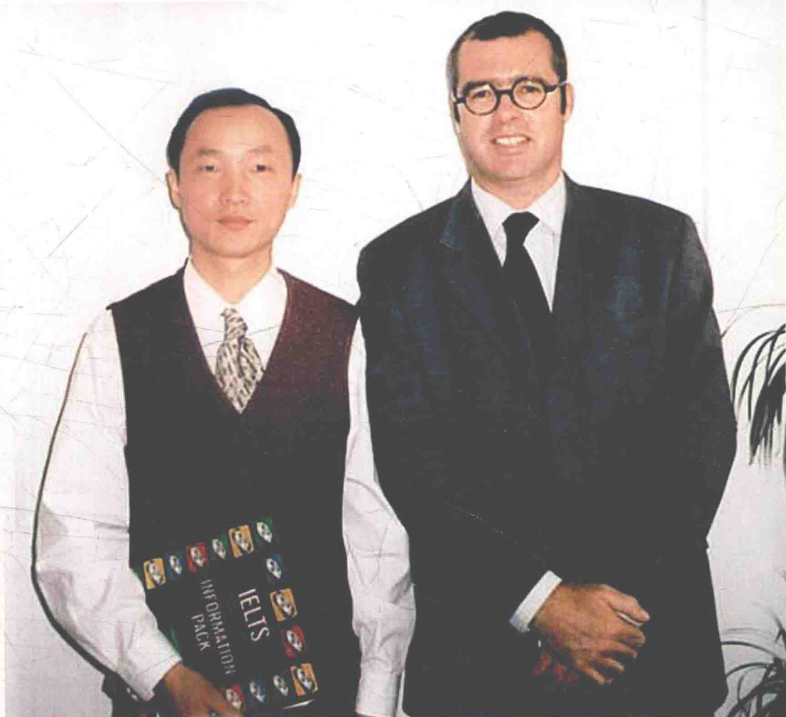
1999年8月，英国文化委员会全球雅思负责人肖恩·海德先生在英国伦敦与“中国雅思之父”胡敏教授亲切会晤。