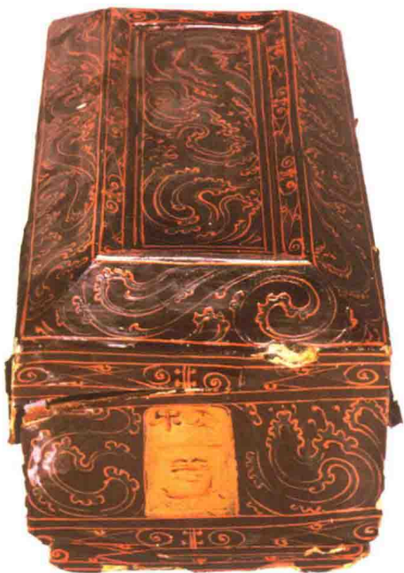
西汉“梅一笥”铭彩绘云气纹漆笥

种特殊的技法是“彩绘”，主要用于丧礼器物上。这种技法不施底漆，直接在木胎上绘以朱、黄、银、绿等天然矿料，题材诡异，风格神秘。“针刻”则是又一种装饰手法。在杯盘等小型器皿上，常用针尖刻画出主体纹样，然后以漆绘勾饰轮廓。