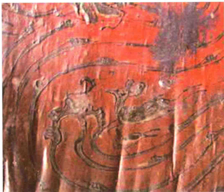
汉代广陵国出土漆器纹饰

汉代扬州漆器的胎质，主要有木、纆、竹、铜、陶等。漆艺的分工细致，有漆工、泡工、造工、素工、髹工、上工、画工等。比起其他地方的漆艺来，当时的广陵还有一种用金银薄箔贴在器物表面的工艺被广泛运用。因其金银相间、辉光闪烁，加上表现的都是珍禽异兽、山树云气，因而显得特别光怪陆离、富丽堂皇。这一工艺也是后来“金银平脱”技法的前身。另一