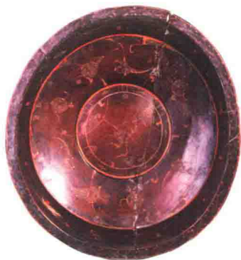
战国彩绘龙凤纹漆盘

扬州是古代中国木胎漆器的发源地，也是当今中国漆器的重点产区。如今，扬州漆器髹饰技艺已被列为国家级非物质文化遗产。