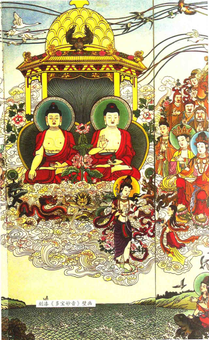
刻漆《多宝妙音》壁画