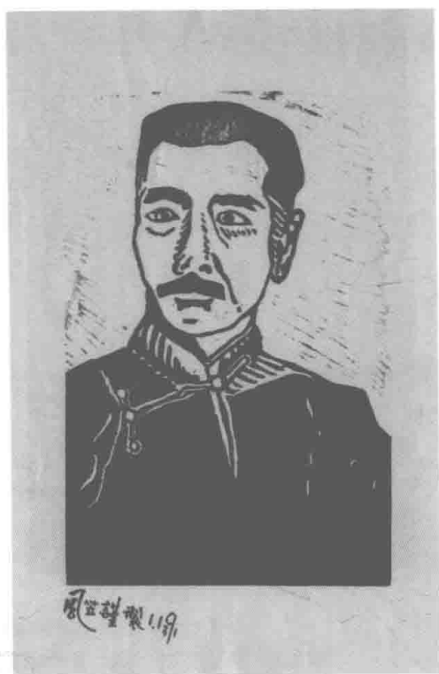
梵澄留德期间所作木刻画《鲁迅像》