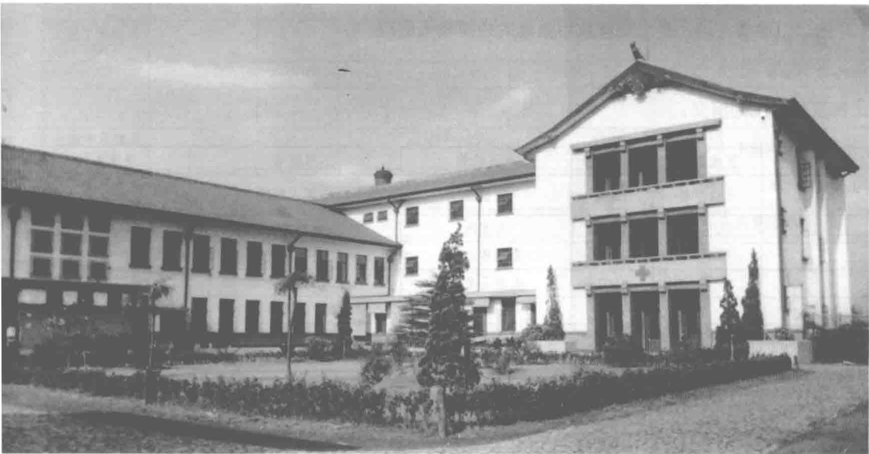
解放后新建的建筑工程人职工医院

新中国新建医院的建筑风格也贯彻了实用经济原则，外貌朴素，功能实用。到 1966 年，医院总数达 346 所，医院床位数 33381 张。新建市级医院有新华医院、龙华医院、肿瘤医院、儿科医院和精神病防治总院等，区县级中心医院有普陀、闸北、闵行、南汇、青浦等医院。扩建中心医院有吴淞、金山、奉贤、崇明等医院，基本上