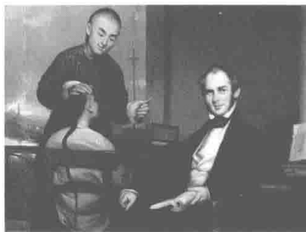
美国传教士伯驾 (Dr. Peter Parker, 1804-1888) 在广州开了一间药房，为中国人看病，这就是博济医院的雏形