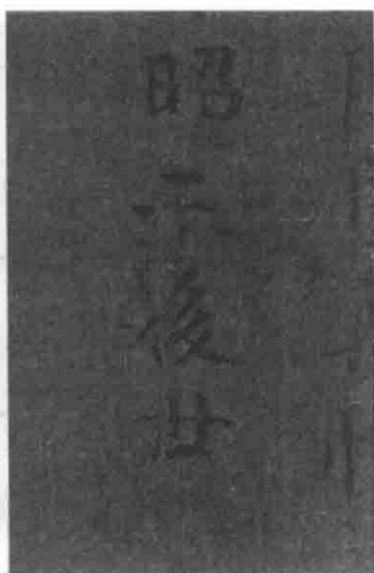
图 2c 装补原位示意图， 原位图

人 / 书一编，佐汉兴王无后艰；客有为□（我）□（桡）楚 / 权，请借前箸输忠谈；南 宫偶语事寝阑，即 / 日劝驾西都关；羽翼已成储嗣安，愿与赤 / 松求神仙；高名万世长 鏗鉤，再拜清风何 / 所言；望之俨然即之温，奇伟魁梧焉足论。