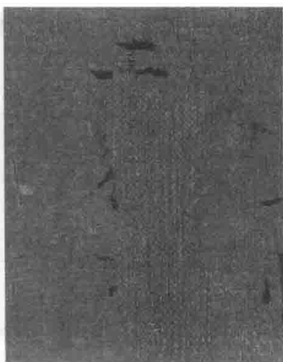
图 2b 装补原位示意图， 第 2 部分