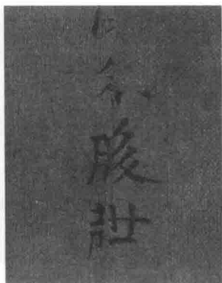
图 2a 装补原位示意图， 第 1 部分