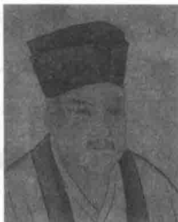
图 3b 《八相图》中 推测为秦桧的图像