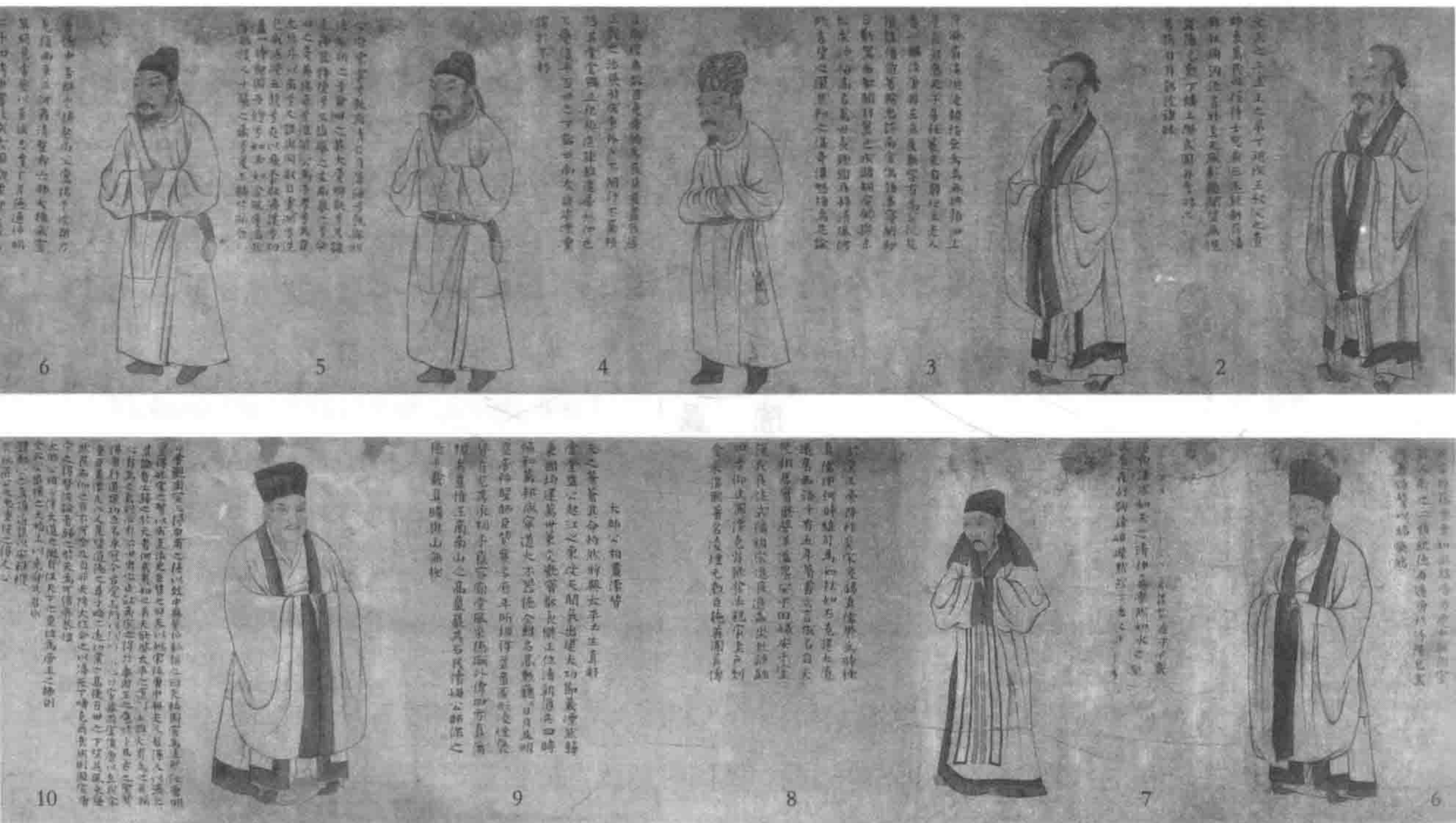
图1 (南宋)佚名《八相图》文字部分编号图示

魏徵、狄仁杰、郭子仪、韩琦、司马光和周必大。学界对此并未提出疑义，笔者先前也基本认定该作所画为此八相。许浩然《一幅南宋绍兴年间的秦桧画像——故宫博物院藏〈八相图卷〉考辨》一文首次提出了第八位名相为秦桧，并作了相关考辨 1 。