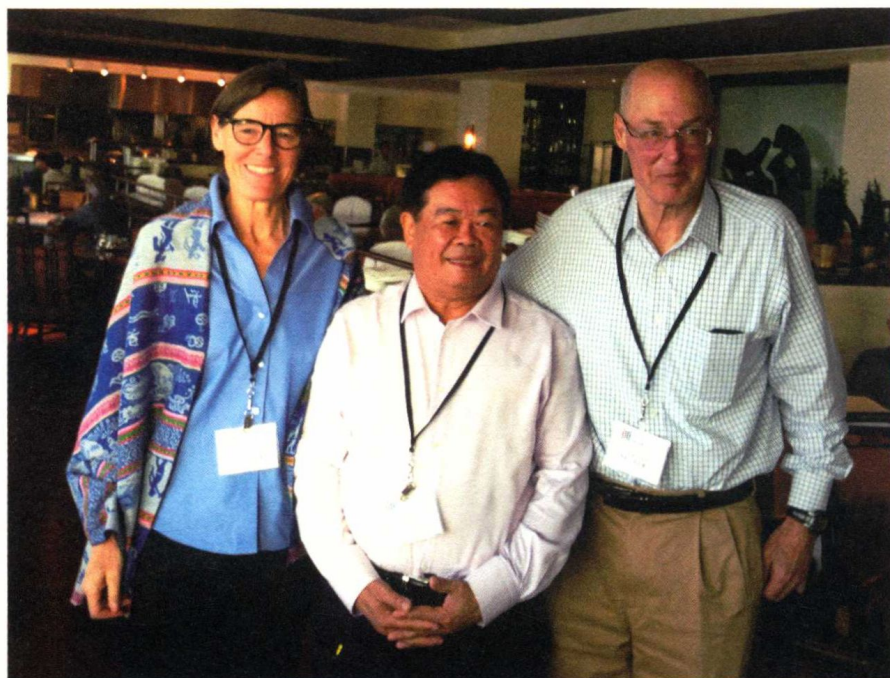
在夏威夷会议期间，与美国前财政部长保尔森先生及夫人合影。