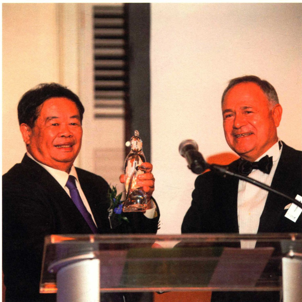
2016年10月6日，曹德旺获颁全球玻璃行业最高奖项——凤凰奖（the Phoenix Award）。