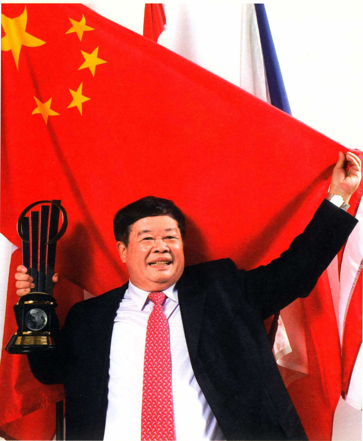
2009年5月，曹德旺从全球43个国家和地区代表中脱颖而出，荣膺“安永全球企业家2009大奖”（Ernst & Young World Entrepreneur of the Year® 2009），成为该奖设立以来首个华人得主。