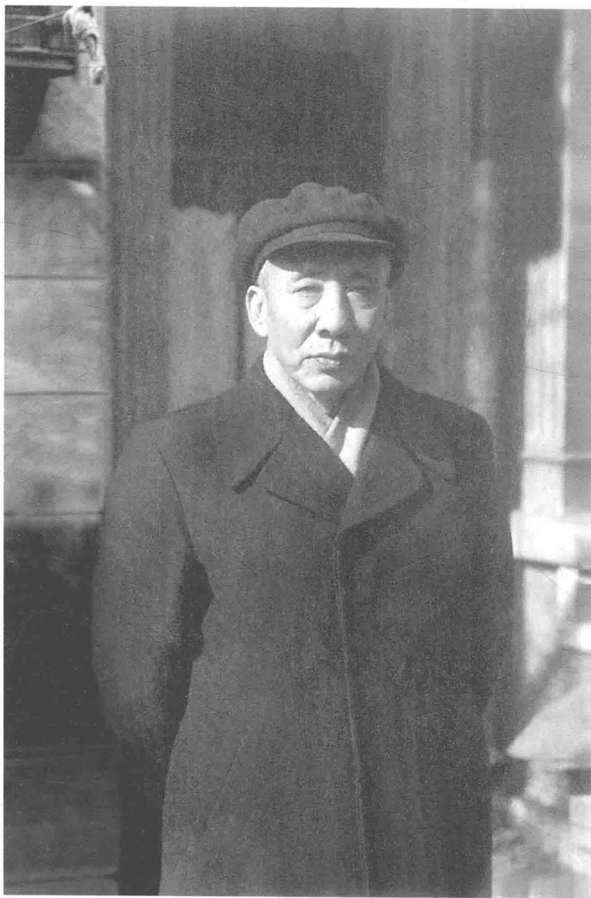
20 世纪 80 年代初孙犁在天津市多伦道寓所门前