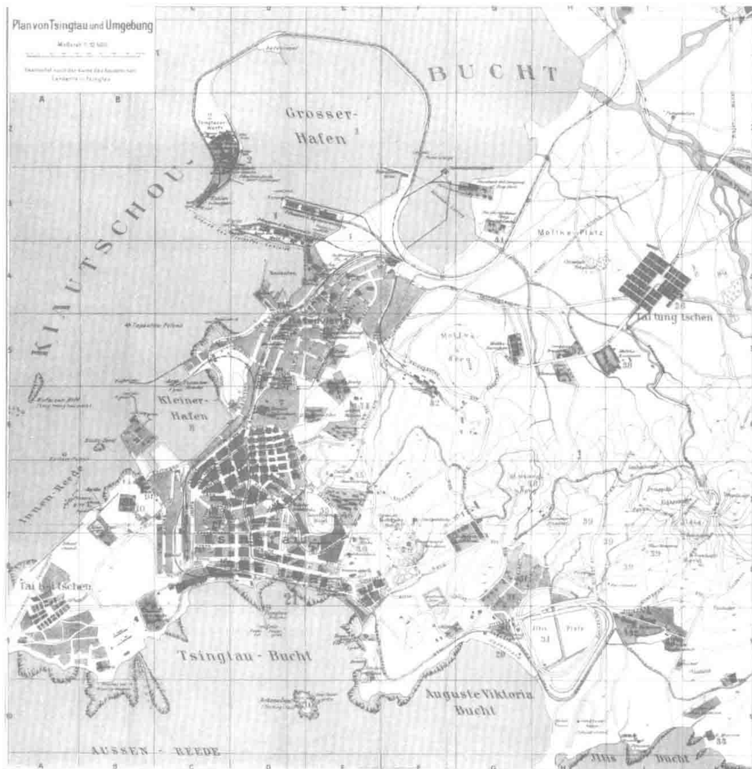
图 1-2 青岛及周边地图，1913 年

路以胶东主要城镇及青岛周边地名命名。北部道路呈方格状，南部两条斜向道路平行于霍恩洛厄街。商贸区位于欧人区西侧，向西一直延伸至胶济铁路，道路以德国主要海港城市命名。小工业区位于商贸区北侧，依托小港，紧靠铁路线，道路以中国北方地名命名（图 1-3）。