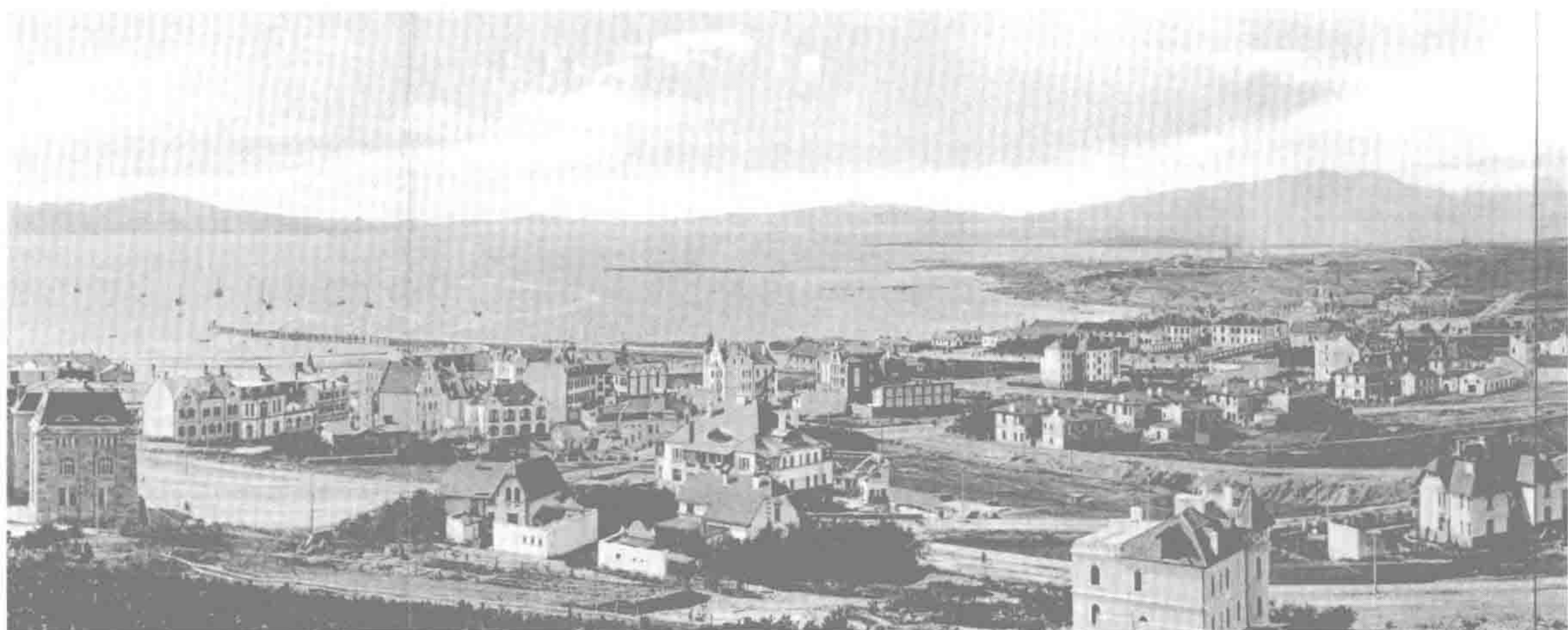
图 1-3 欧人区俯瞰，1906 年

台东镇和台西镇。率先建成的台东镇作为示范，采用了东南—西北方向的棋盘状街道系统。街道平均宽 10 米，将该区划分为 84 个长宽各为 25 米和 50 米的长方形街坊。台西镇晚于台东镇两年建成，街坊尺度与台东镇大体相同，但规模较小，路网体系更为灵活自由。 4