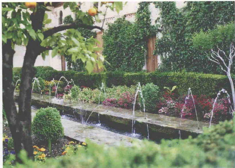
一个带小喷泉的水池在花园里具有装饰效果。