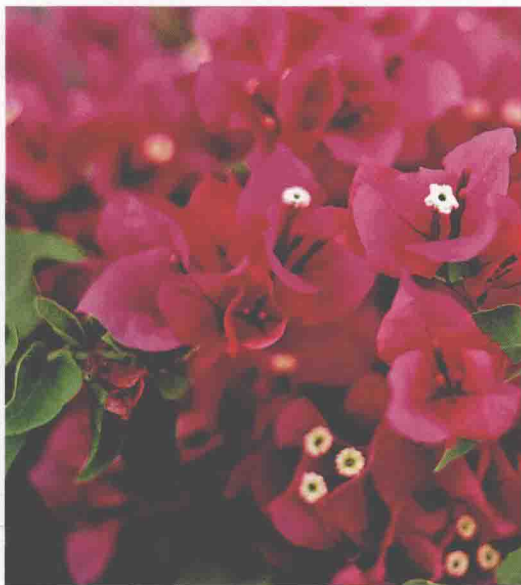
三角梅浓郁的色彩是南方异国情调的一个缩影。

左图：位于普罗旺斯和西班牙南部的托斯卡纳，以其独特的地方色彩，吸引着众多的度假者。