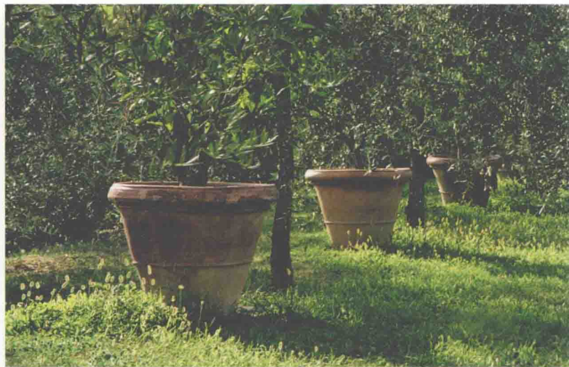
古典陶罐和橄榄树是非常典型的设计元素。

庭院的周围不断上演着故事。就在赫内拉里菲宫的下方，坐落着摩尔人统治者的城堡——阿尔罕布拉宫，其内院被设计为依次排开，狮子厅是这些庭院中最著名的一个，因12个石狮簇拥着的喷泉而享誉世界。