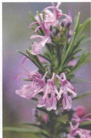
用花香实现地中海氛围，迷迭香是不二选择。

一开始就得提前认识到：这本书中提出的建议和设计实例并不是完全体现在种植修长的柏树和古老的橄榄树或者摆放陶制器皿这样的细节里。建造地中海式花园的大方向得先确定，然后才能为其寻找创意。这时，不仅仅是地面处理和众人皆知的比例规则的运用起作用，在当地生长期长的植物品种，也可以为地中海式花园的建造提供无限可能。