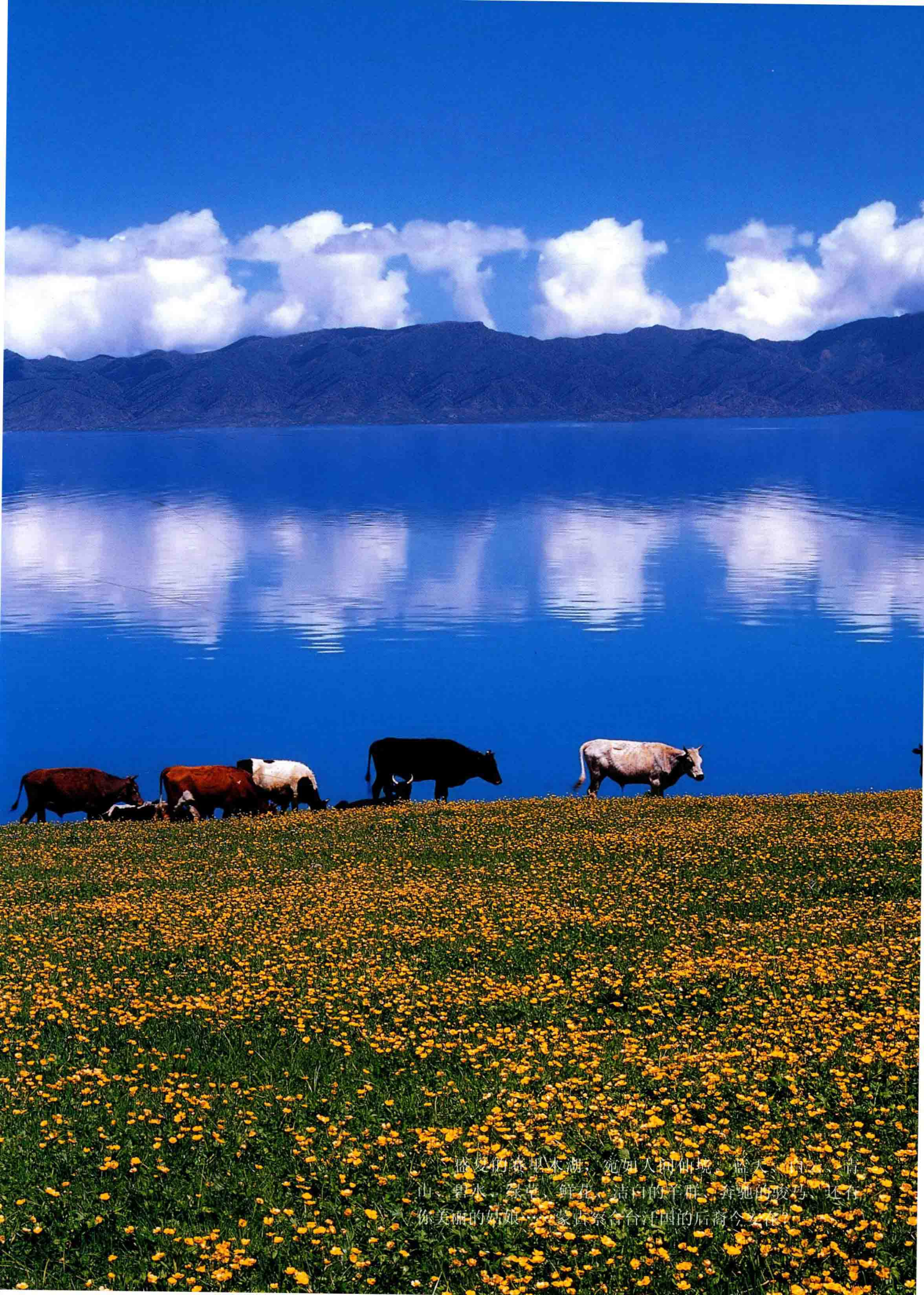
盛夏的赛里木湖，宛如人间仙境。蓝天、白云、青山、碧水、绿草、鲜花、洁白的羊群、奔驰的骏马，还有你美丽的姑娘……蒙古察合台汗国的后裔今安在。