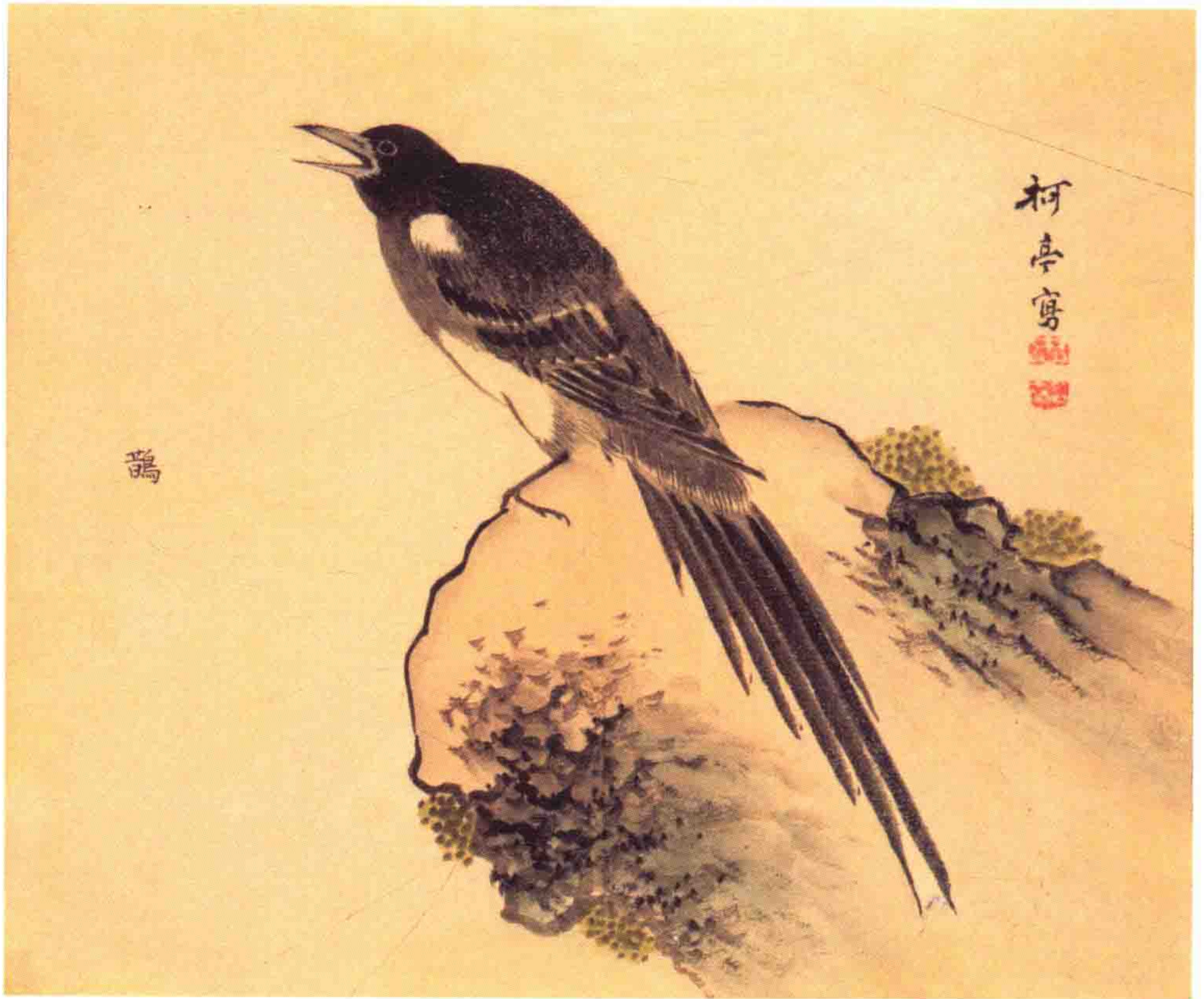
鵲 鸟类。头背黑褐色，背有青紫色光泽，肩、颈、腹等白色。尾巴长，鸣声啾啾，通称喜鹊。