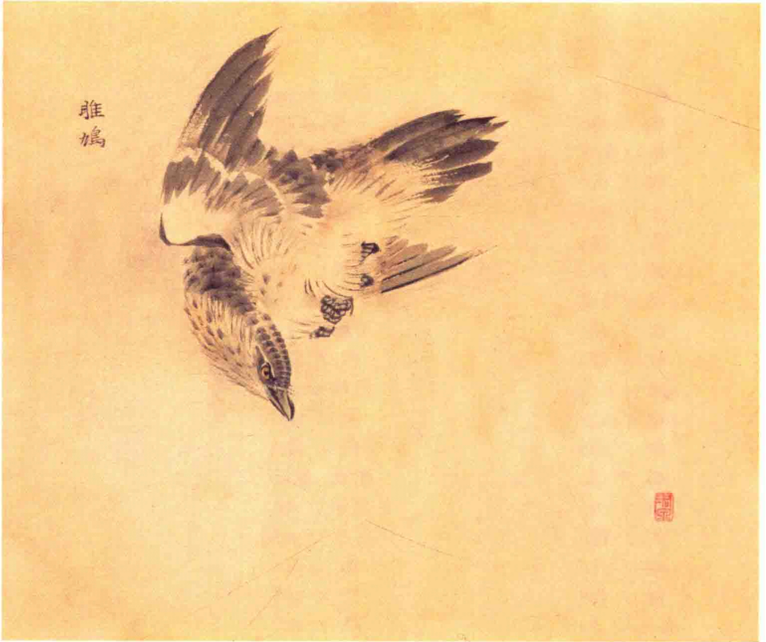
雕鳩 （音同加）鸟类。上体暗褐，下体白色。趾具锐爪，适于捕鱼。