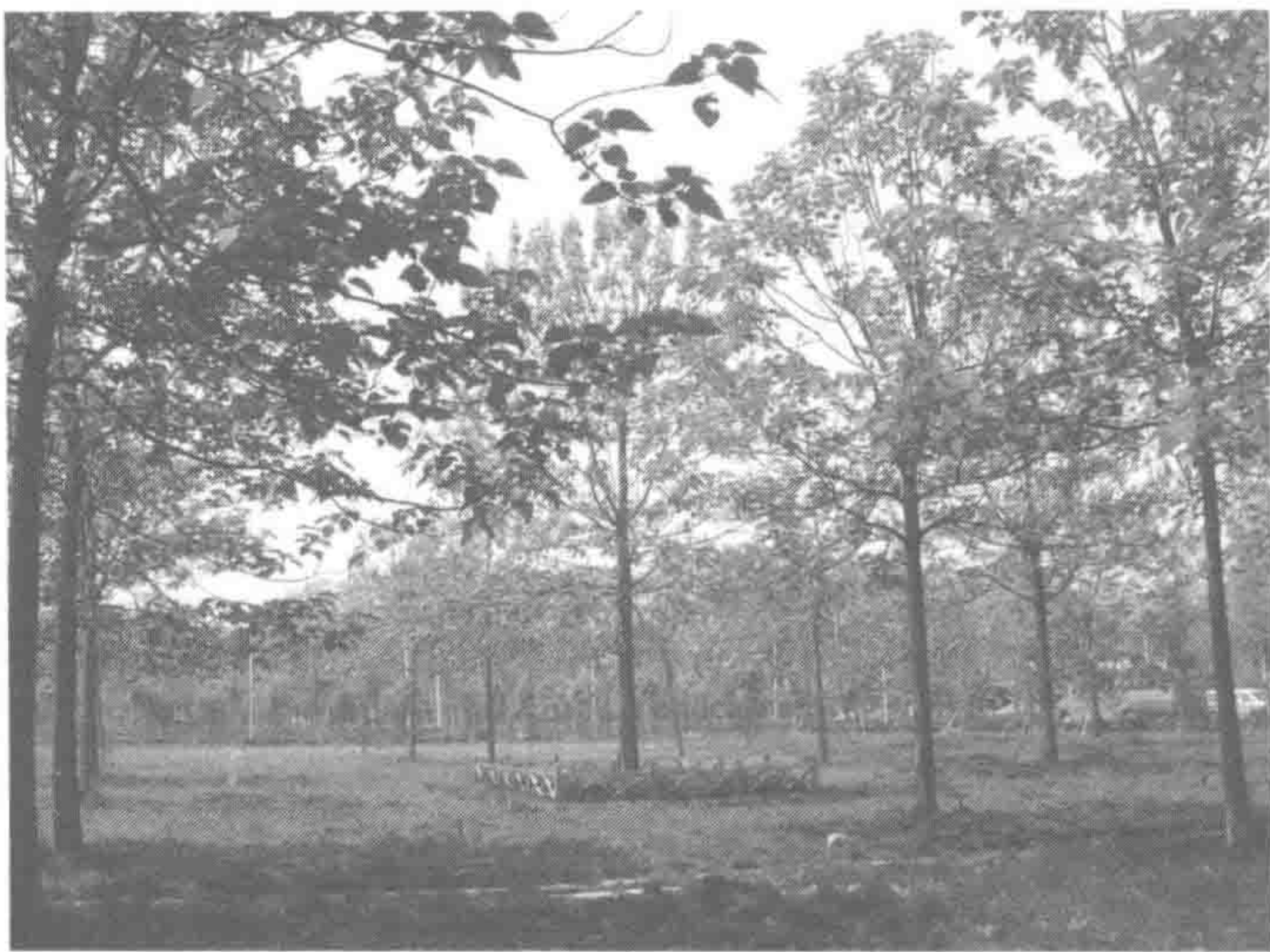
2009年习近平在焦裕禄工作过的地方种下一棵泡桐树

时隔五年，2014年3月17日，在党的群众路线教育实践活动的政治背景下，习近平再来兰考。根据中共中央统一安排，每位政治局常委在第二批群众路线教育实践活动中分别联系一个县，习近平选择了兰考。