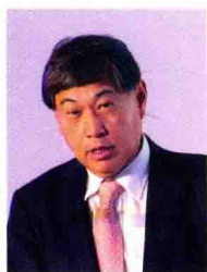
| 王波明 |

中国证券市场研究设计中心总干事、联办集团首席执行官、《财经》杂志总编、《证券市场周刊》社长、中国证券业培训中心副理事长、中国国债协会理事、亚洲证券业培训学院理事。20 世纪 80 年代赴美留学，先后在纽约市立大学获学士学位、哥伦比亚大学获国际金融硕士学位。曾参与中国早期资本市场的建立，包括上海和深圳证券交易所的筹建。1992 年又参与设计中国第一个投资基金，从而开创了机构投资者先河。2015 年被授予法国荣誉军团骑士勋章。2016 年获得哥伦比亚大学国际与公共事务学院的最高奖项——国际领袖奖。