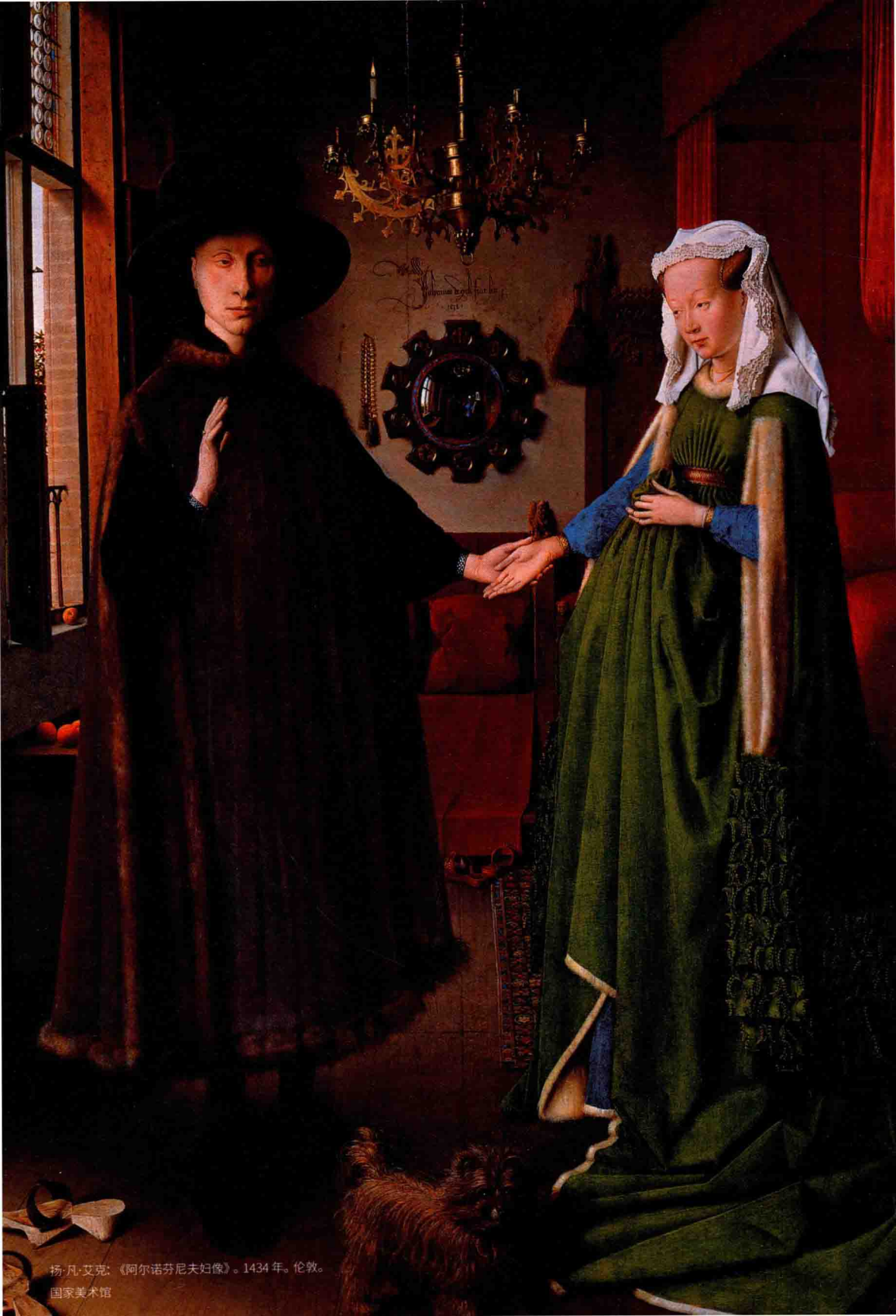
扬·凡·艾克：《阿尔诺芬尼夫妇像》。1434年。伦敦。 国家美术馆