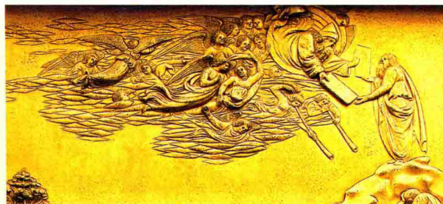
吉尔贝蒂在圣若望洗礼堂东门的浮雕上多次运用“探身”大招