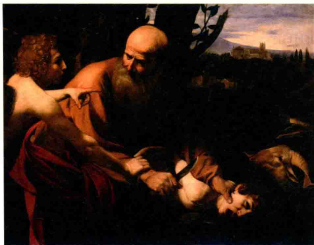
卡拉瓦乔的《以撒献祭》