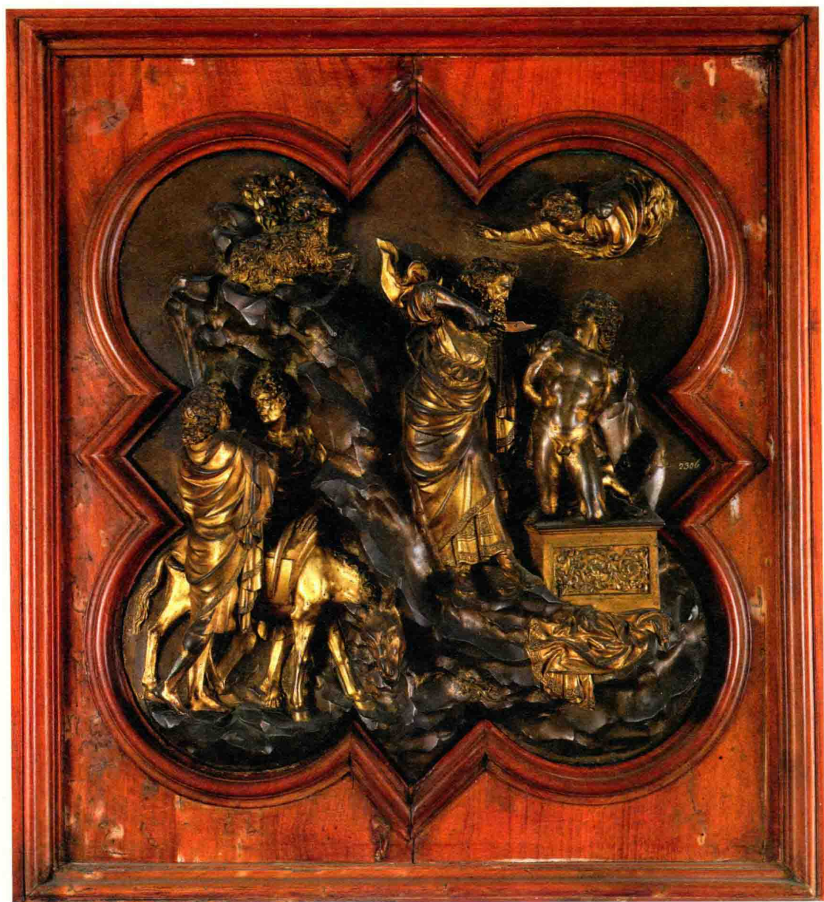
吉贝尔蒂的《以撒献祭》