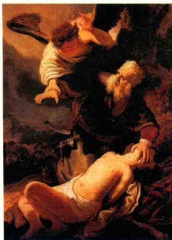
伦勃朗的《以撒献祭》

作，时常征求 34 名评委甚至路人对他作品的意见，并几易其稿。而布鲁内莱斯基则把自己藏了起来，他一生最忌讳别人偷窃他的创意，笔记都用密码书写，据说他还是欧洲申请专利的第一人。一年之后，两人毫无悬念地杀入决赛，可评委们面对这两件旷世名作却犯了难。