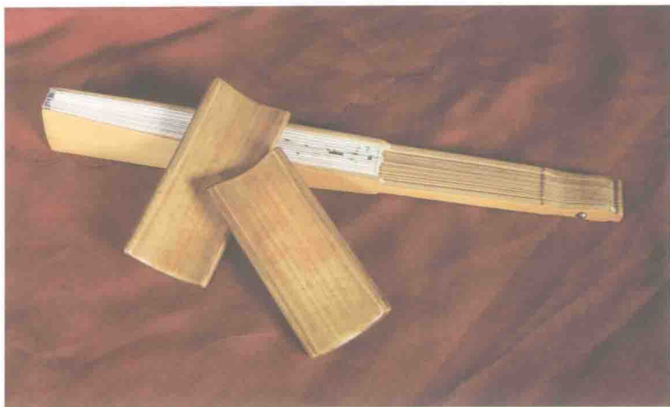
◎ 演出乐器玉子和道具折扇 ◎

太平歌词既不像京腔大戏，有文武场面；也不似琴音鼓书，有丝弦伴奏。它的演出形式，就是一个人打着两片竹板演唱，道具最多再加上一把折扇。演员通过开场板“单点”与“连环点”的精妙配合，运用甩腔、俏口、沉韵的声腔技巧，并辅以闪板、垛子板、流水板的节奏变化，将歌词娓娓唱来。表演起来活灵活现，可谓一人撑起一台大戏。