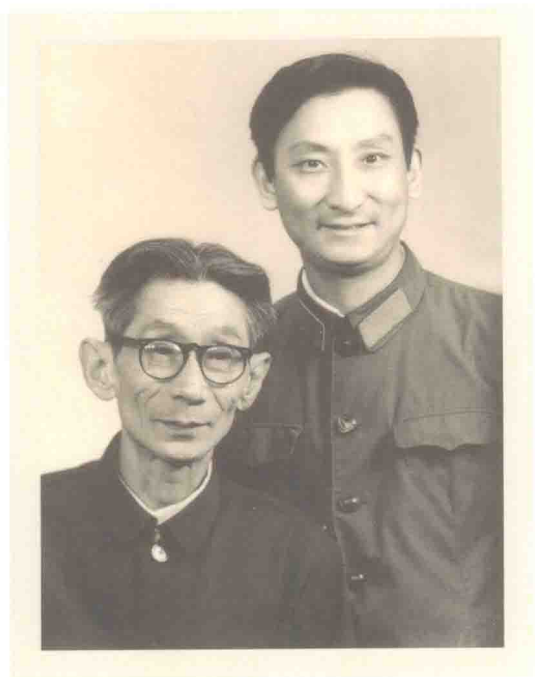
◎ 马三立、王双福祖孙合影 ◎