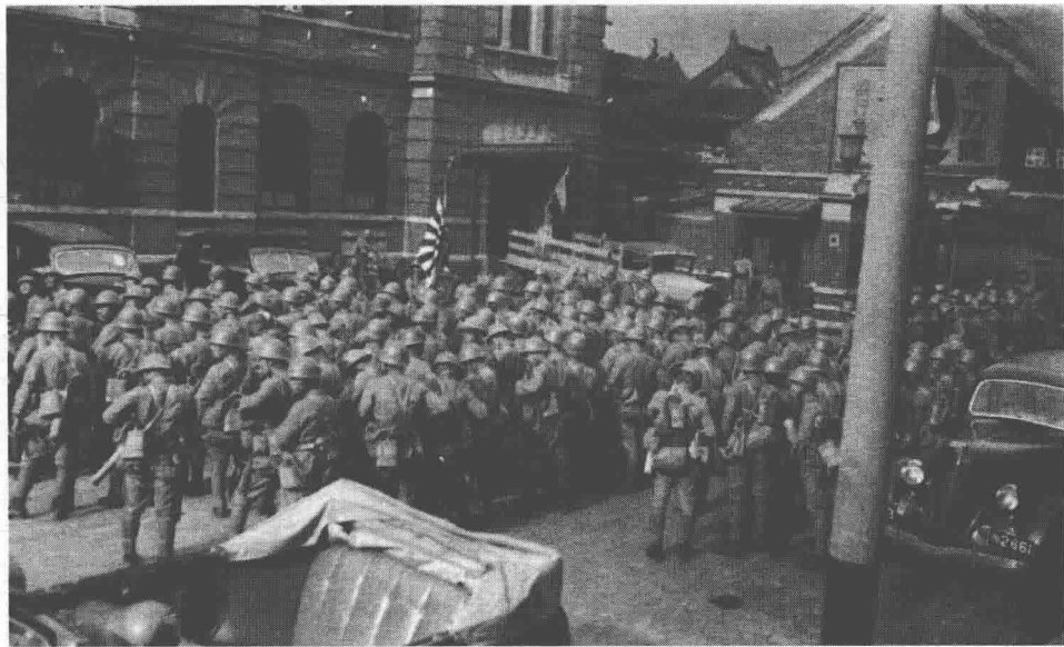
在上海的日本海军陆战队

8月4日，日本海军第三舰队司令官长谷川清中将要求，第三舰队内的陆战队人员秘密登陆上海。当时日本海军在上海的地面兵力有：上海特别陆战队2500名，吴镇第2、佐镇第1特别陆战队约1200人，“出云”号陆战队约200名，第十一战队陆战队约120名，总计4000余人。他们装备有九四式37毫米速射炮4门、九二式70毫米步兵炮4门、四一式75毫米山炮12门、八八式75毫米高射炮4门、三八式120毫米榴弹炮4门、改四年式150毫米榴弹炮4门、150毫米重型迫击炮8门；战车有八九式中战车4辆、装甲车6辆、机枪车9辆；同时日军最开始