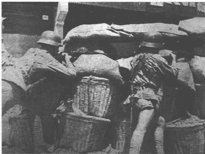
进攻日本海军陆战队的中国军队

特别陆战队共 1400 名士兵搭乘第四水雷战队的船只及“长鲸”号军舰出发，8 月 19 日夜抵达上海。算上上海现有的海军陆战队士兵，在上海的日本海军陆战队人数约 6300 余人（不算之前阵亡、负伤的）。除此之外，日本政府已经指定一名陆军大将指挥 2 个师团兵力增援上海。