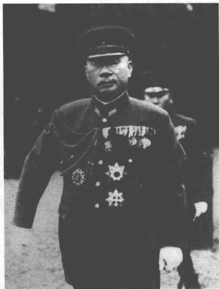
日本陆军大臣杉山元

因动员全部兵力需要10天左右，所以8月1日先运送第一批紧急动员的部队。第一次动员征用10万吨船舶，同时