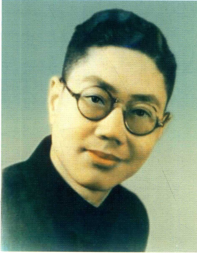
朱良春先生摄于1946年