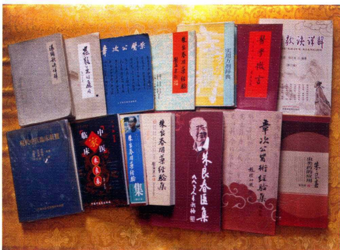
朱老出版的部分著作