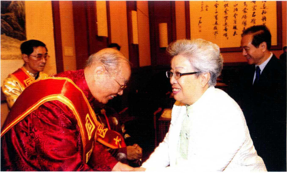
2009年6月，朱老荣获人力资源和社会保障部、卫生部、国家中医药管理局首届“国医大师”称号，原国务院副总理吴仪亲切会见并表示祝贺