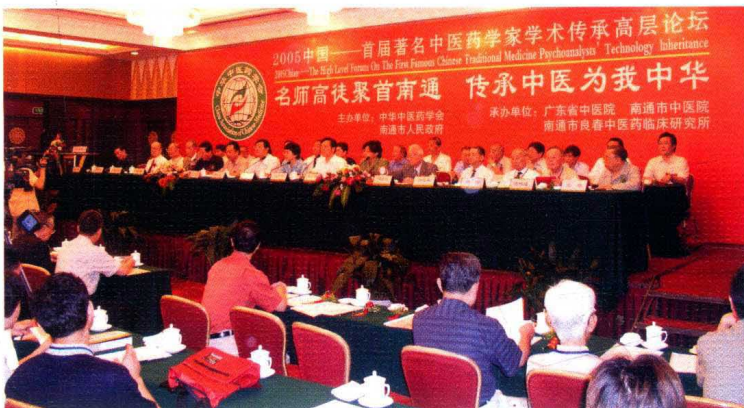
2005年6月，邓铁涛、朱良春等十位全国名老中医发起倡议，由中华中医药学会、南通市政府主办，广东省中医院、南通市中医院、良春中医药临床研究所承办的“首届著名中医药学家学术传承高层论坛”在南通召开，余靖副部长和省、市等领导，以及中医泰斗、高徒等300余人出席，盛况空前