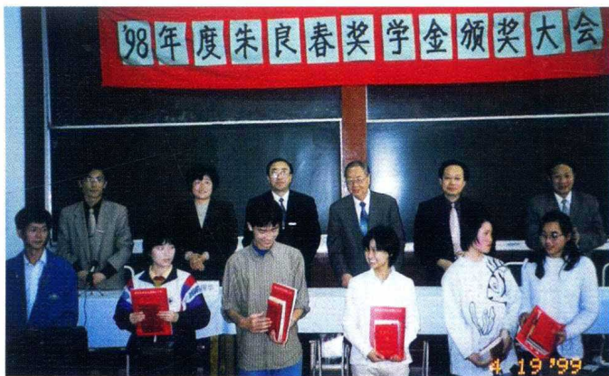
1999年，朱老捐资在南京中医药大学设“朱良春奖学金”，并于2006年增捐资设立“优秀学生奖励基金”，为培养中医后备军尽绵薄之力