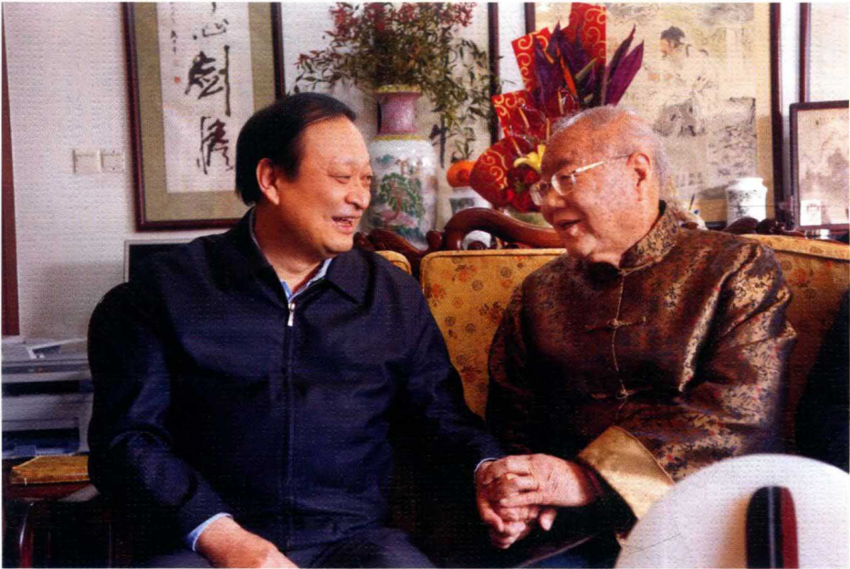
2014年2月，国家卫计委副主任、国家中医药管理局局长王国强视察、指导南通卫生及中医药工作，并专程看望朱老，与朱老促膝交谈中国中医药的传承与发展