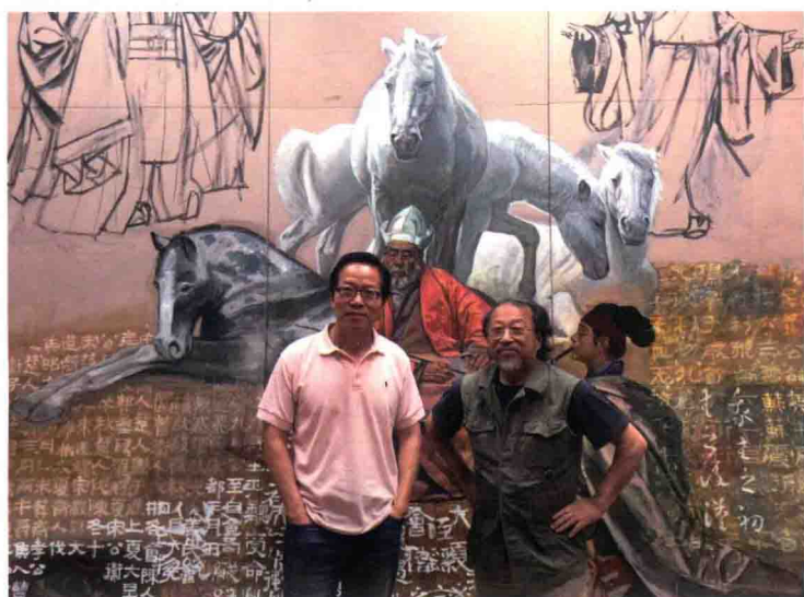
作者与知名澳洲华裔画家沈嘉蔚(右)在其画室