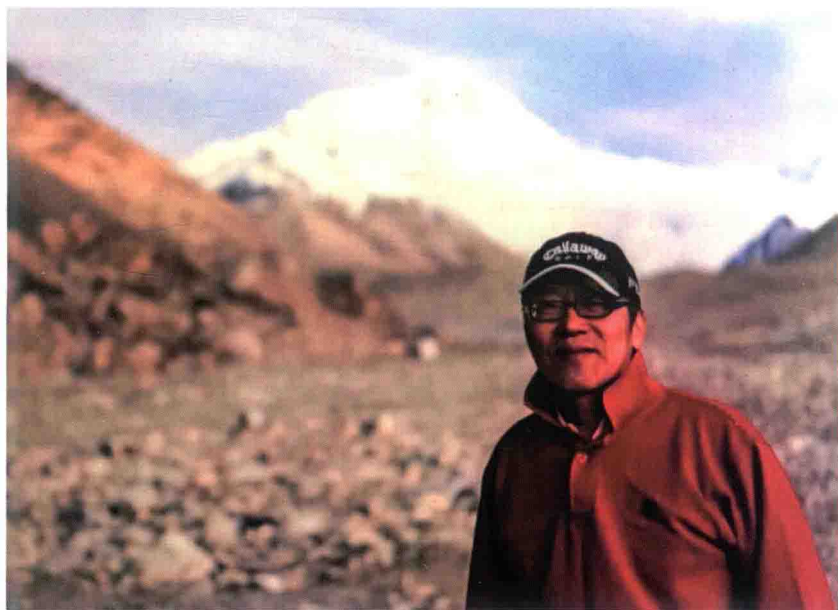
作者 2015 年 6 月 30 日黄昏在珠峰前 身后通往珠峰登顶的二三十公里将是死亡之路