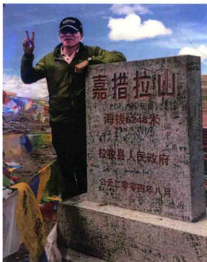
作者在嘉措拉山界碑旁