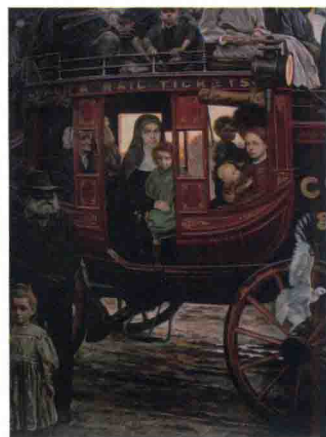
沈嘉蔚油画《澳大利亚的 玛丽·麦格洛普》 (作于 1994 年)