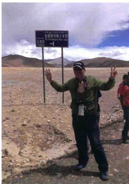
作者在珠峰大本营路标前