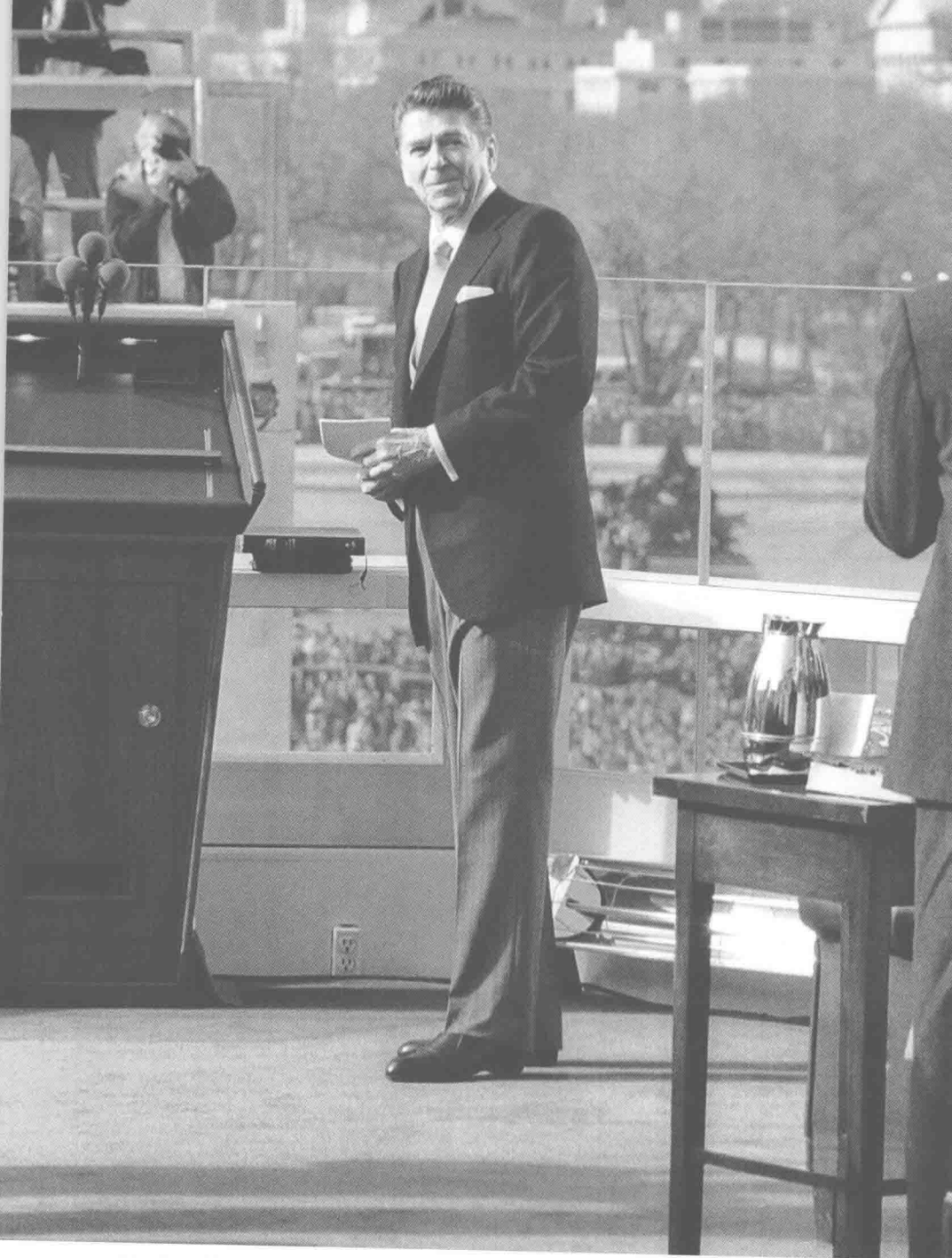
1981年1月20日，里根迈上自己最大的舞台。在这儿，他将首次作为美国总统对全世界发表讲话。