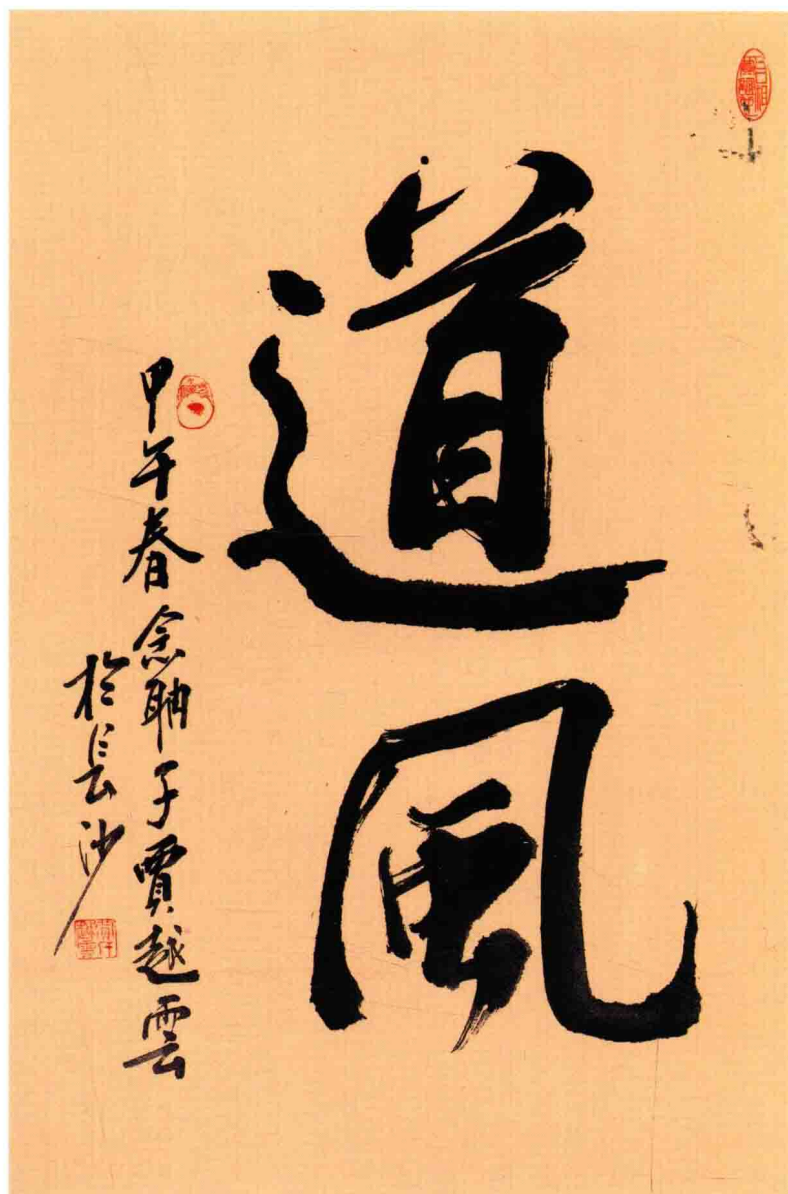
插圖 2-2 賈越雲書法 道風 68×46cm 2014 年