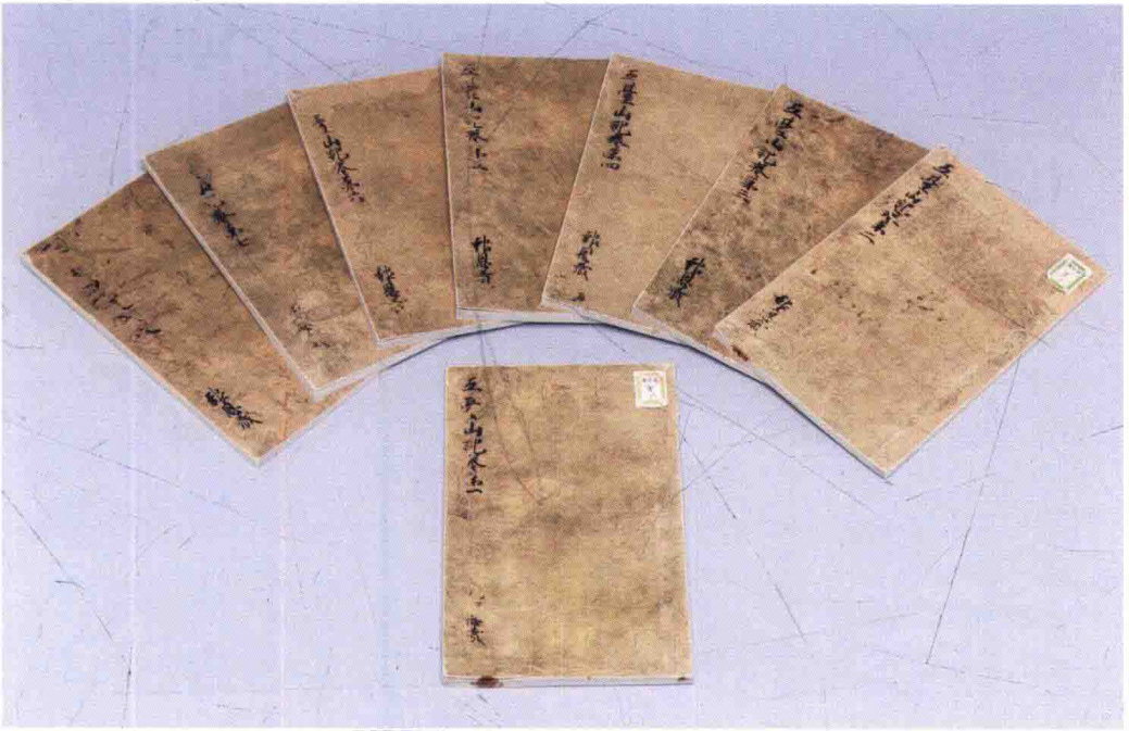
日本京都东福寺藏手抄本之复制本