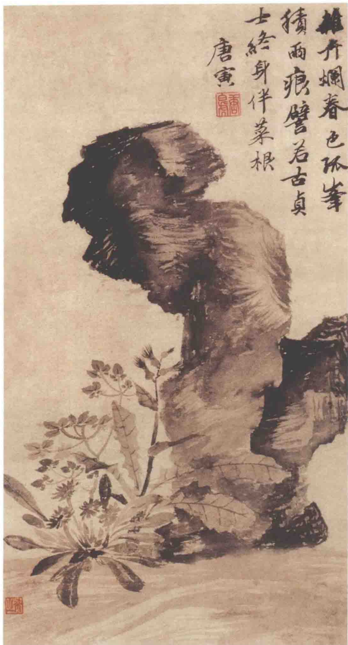
明 唐寅 立石丛卉图 纸本 52.6×28.6厘米