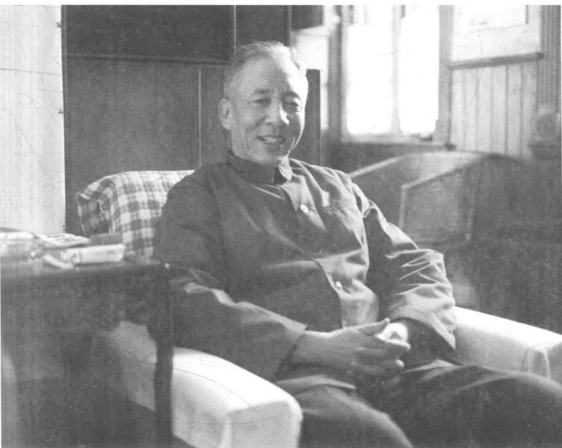
20 世纪 80 年代中期，孙犁在天津市多伦道寓所