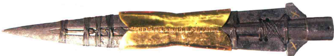
▲现藏于维也纳霍夫堡珍宝馆的“朗吉努斯之矛”，黄金包片上的铭文为“LANCEA ET CLAVUS DOMINI”，意为“主的矛与钉”