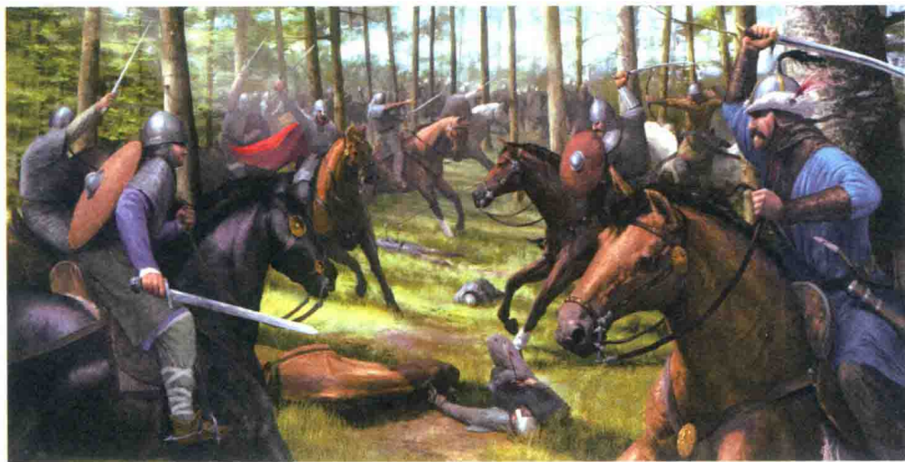
▲莱希费尔德之战，东法兰克骑兵和马扎尔骑兵在今日奥格斯堡附近激战

此后，“捕鸟者”亨利的儿子，年仅24岁的奥托成了国王。他个性热情、表情丰富，脑海里都是做大英雄的各种幻想。在后世，奥托一世被誉为“大帝”和“德意志之父”。他率领举国兵力，高举圣矛激励士气，于955年8月10日的圣劳伦蒂乌斯日，在莱希费尔德一举将骚扰欧洲多年的马扎尔人击溃，以辉煌的军事胜利开始了德意志的历史。莱希费尔德之战具有极其重大的历史意义，失败后的马扎尔人定居在东部边界成为匈牙利人，并皈依天主教形成匈牙利王国。曾经侵略骚扰欧洲的游牧民族最后却成为欧洲天主教世界的防波堤，并在后世得到了“基督之盾”的美誉。匈牙利王国成为一道屏障，而使中西欧在漫长的岁月中都没有受到东方游牧民族的侵袭和征服，这对欧洲文明有着至关重要的影响。那些来自遥远东方，故乡或许远在乌拉尔山以东的游牧民族，经过天主教的洗礼和周边地区互相通婚，成了真正的欧洲人。只是匈牙利人的名字露了馅，他们把姓放在名之前，与把名放在姓之前的欧洲人截然相反。