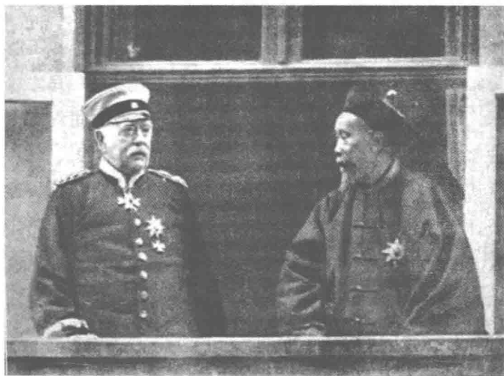
李鸿章与当时的德国首相俾士麦(今译俾斯麦)