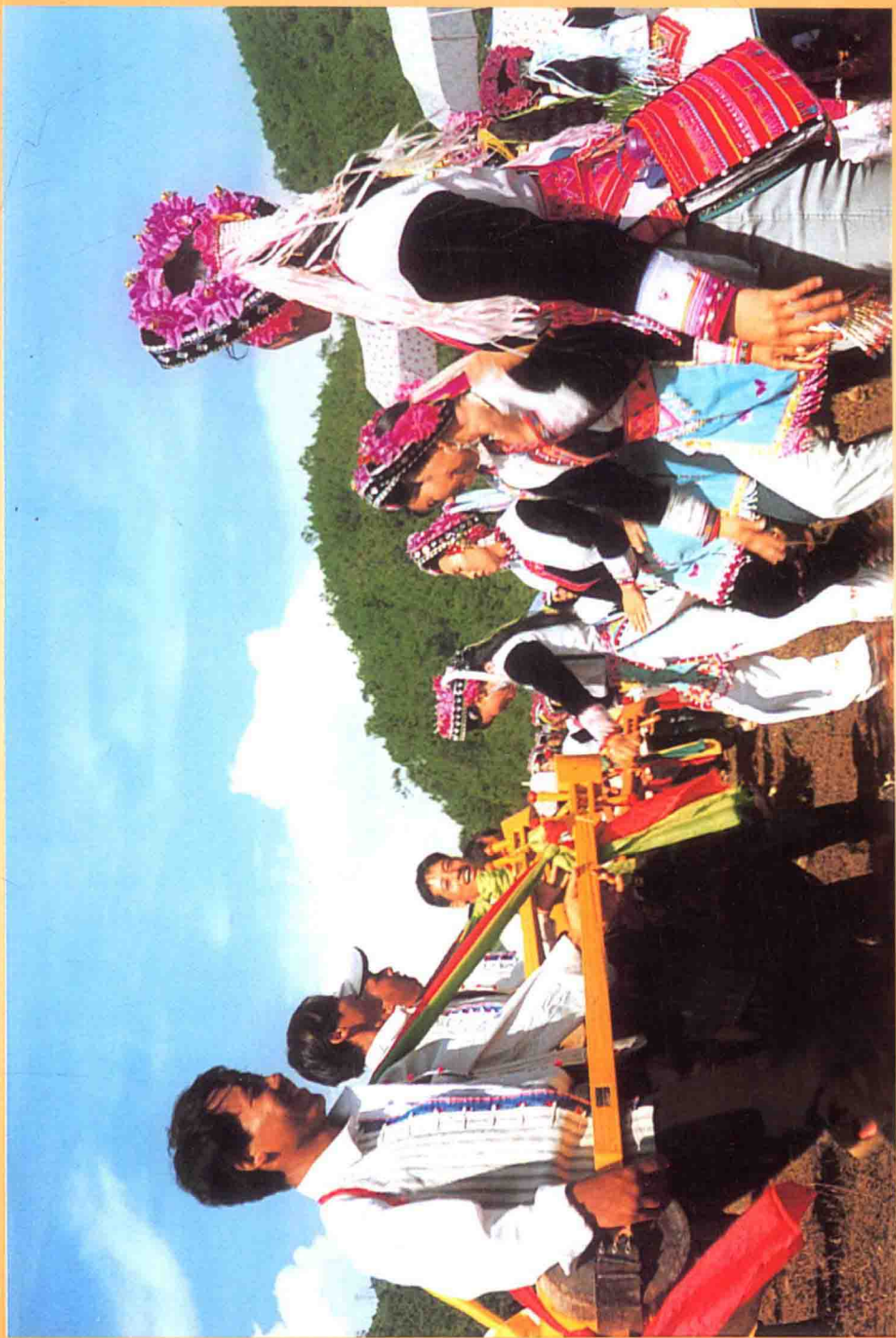
阿 细 跳 月