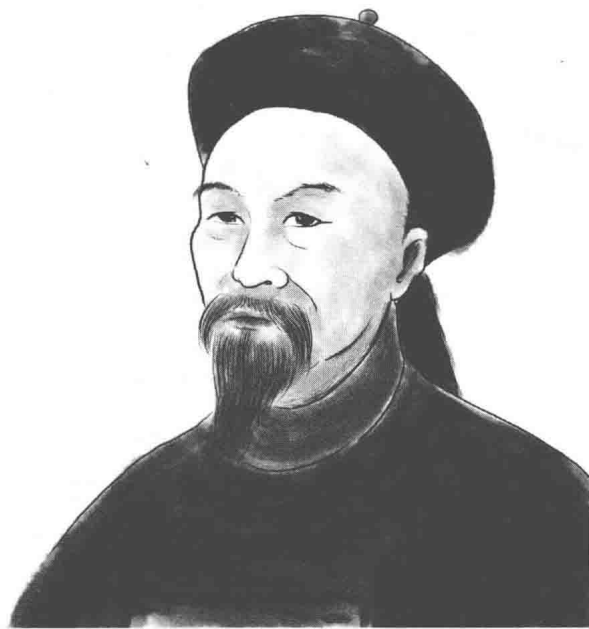
图1-1 李鸿章老年时朝服半身照片

我认为，天底下只有平庸之人既不会挨骂，也不会得到赞誉。如果一个人全天下的人都在骂他，那他就可以称得上是绝非一般的奸雄；如果一个人全天下的人都说他好，那他则可以称得上是货真价实的豪杰。但是说这些话的人绝大多数都是些普通人，其中有见识、有才干的几乎百分之一、千分之一都不到，这样让普通人评论超乎寻常的人，那还有什么价值呢？所以，誉满天下的人未必不是媚俗趋时的伪君子；谤满天下的人未必不是真正的伟人。俗话说“盖棺论定”，我却发现有些人死了几几十年，对其评价还是众说纷纭。说好的还在说好，说坏的还在说坏，让评论家、观察家无所适从。比如说，有的人被成千上万的人赞扬，但诋毁他的人也是成千上万个；夸他的人把他捧上了天，骂他的人却把他贬得一文不值；他今日受到的诋毁恰好可以抵消从前得到的赞誉，他得到的赞誉也恰好补偿了从前所受到的诋毁。像这样的人，该怎么评价呢？答案是，至少可以肯定他是个非凡的人。他究竟是非常的奸雄还是