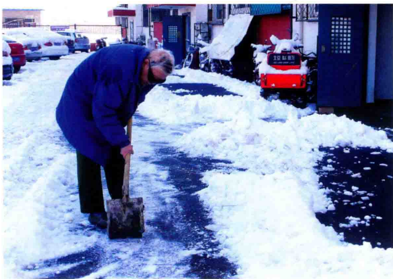
2013年3月20日大雪过后