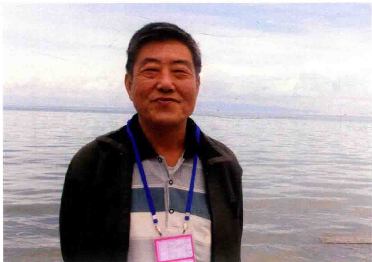
2009年8月在青海湖