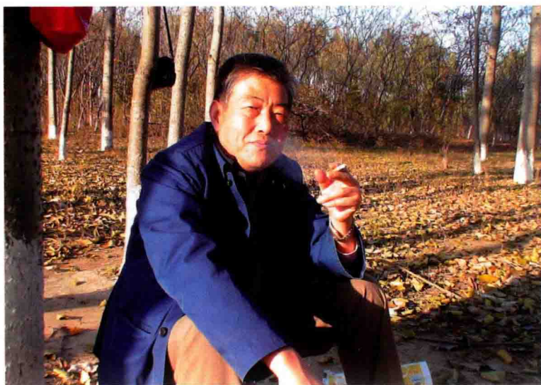
2007年在家附近杨树林