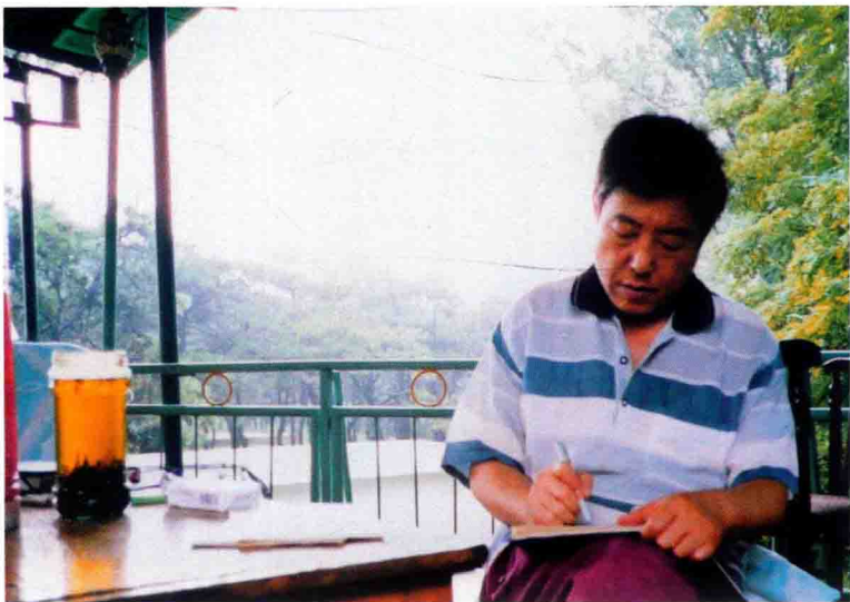
2002年7月于北戴河