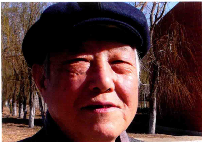
2015年3月21日，回家13周年纪念