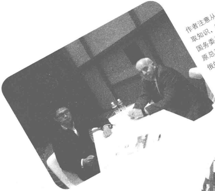
作者注意从书斋之外汲取知识，图为与俄罗斯国务委员、车臣共和国原总理科什曼交流中，俄的历史和发展趋势