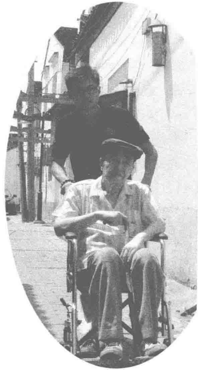
作者曾师从于国学大师朱季海，图为与朱季海先生在一起