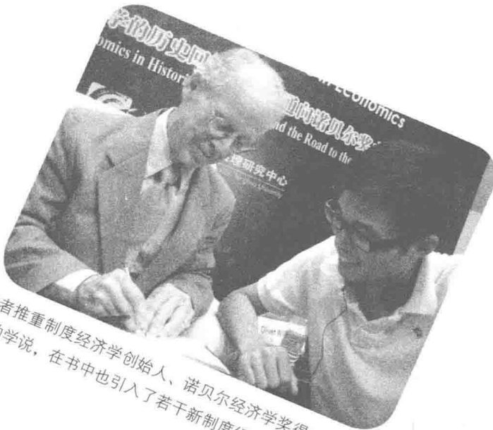
作者推重制度经济学创始人、诺贝尔经济学奖得主威廉姆森的学说，在书中也引入了若干新制度经济学的分析