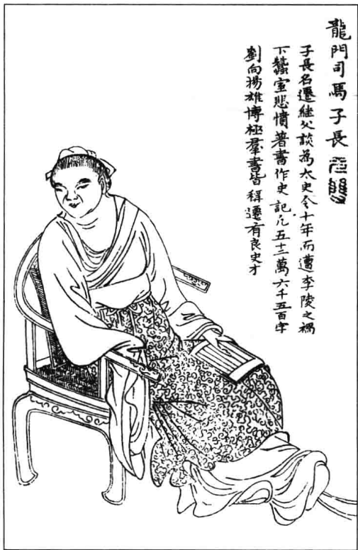
· 司马迁像 ·

太始元年（前96年），汉武帝改元大赦天下，司马迁出狱。武帝让他做了只有宦官才能充任的中书令。司马迁以顽强的意志，忍受着巨大的痛苦，继续专心创作《史记》。至征和二年（前91年），他在写给任安的信中称《史记》的写作已经基本完成。从太初元年开始写作算起，前后经历了14年。公元前87年前后，司马迁逝