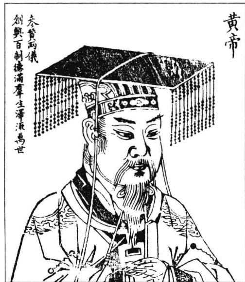
· 黄帝像 ·