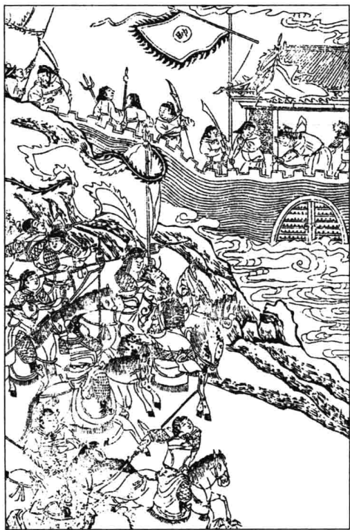
—— 楚汉争霸 ——

例如，项羽是个争霸的失败者，但司马迁却认为项羽是一个可歌可泣的悲剧英雄。《史记》中，司马迁详细记述了项羽的伟业，字里行间饱含热情和强烈的爱。但对于项羽残暴、刚愎自用的致命弱点，司马迁也进行了深刻的批判。又如，虽然司马迁十分愤恨先秦的法家和秦代的暴政，但他做到了不因憎而增其恶。相反，他