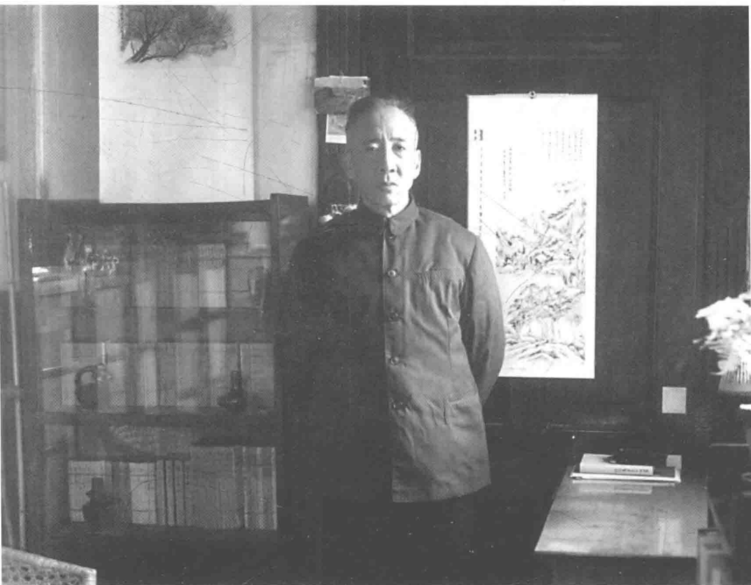
20 世纪 90 年代孙犁在天津市多伦道寓所