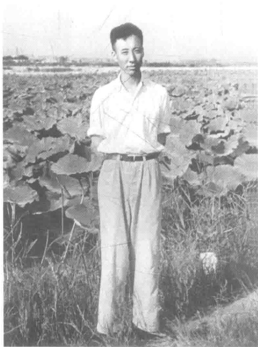
1951年孙犁在天津水上公园荷花池前留影