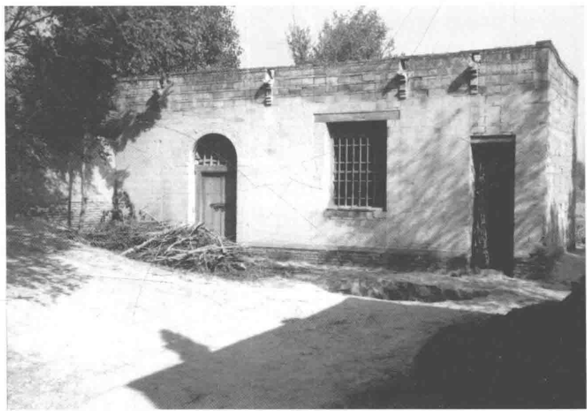
河北省安平县东辽城孙犁故居