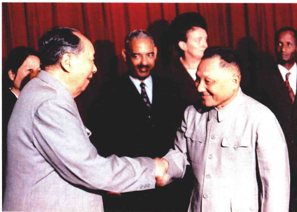
1974年11月12日，邓小平在湖南长沙陪同毛泽东，会见民主也门总统委员会主席鲁巴伊