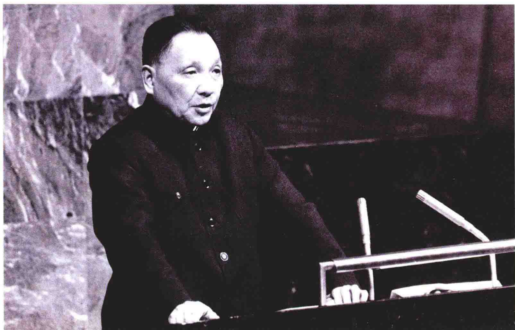
1974年4月10日，邓小平在联合国大会第六届特别会议上发表讲话