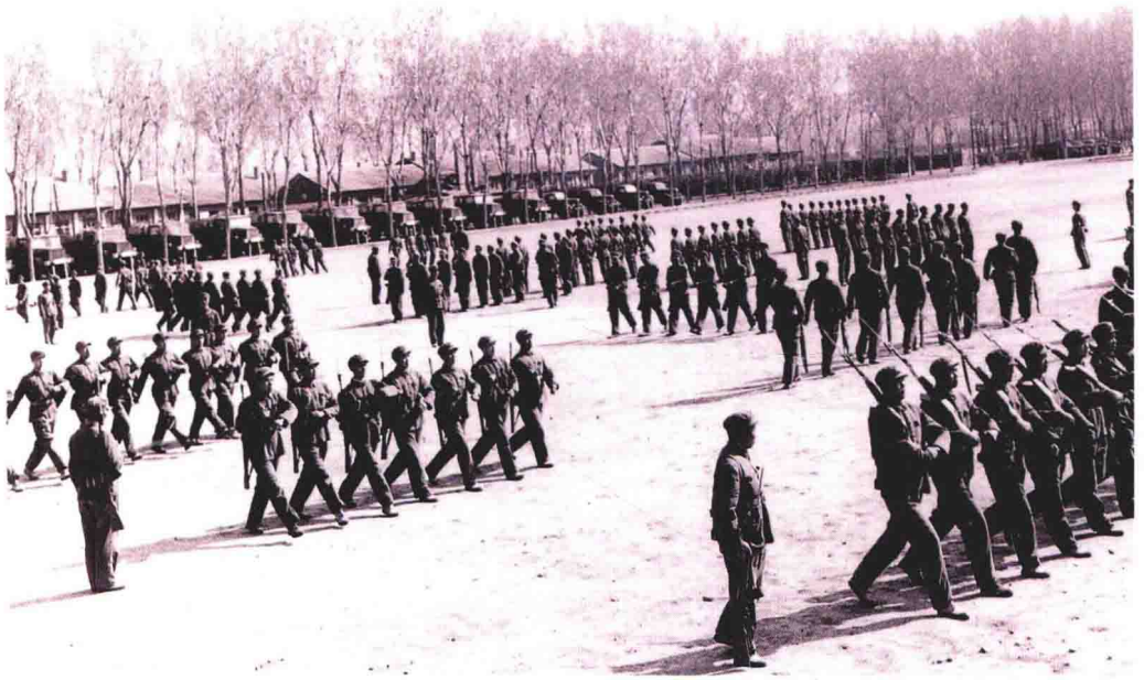
中共中央军委确定，1975年军事训练的重点之一是干部训练。图为某部教导队集训基层干部。