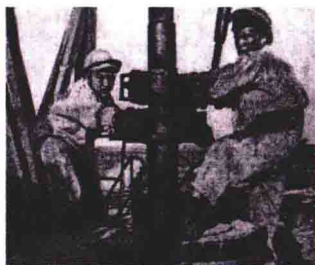
④ 解放前夕，在土匪大山霸压下的石油工人开井社（周敏村）打着“美帝”油桶的旗帜，组织“中国人民解放革命军”，向蛤蟆湖矿进军。