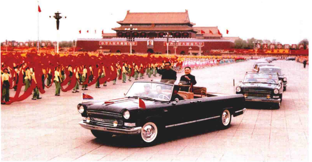
1975年4月18日，邓小平陪同朝鲜最高领导人金日成，乘敞篷汽车经过北京天安门广场