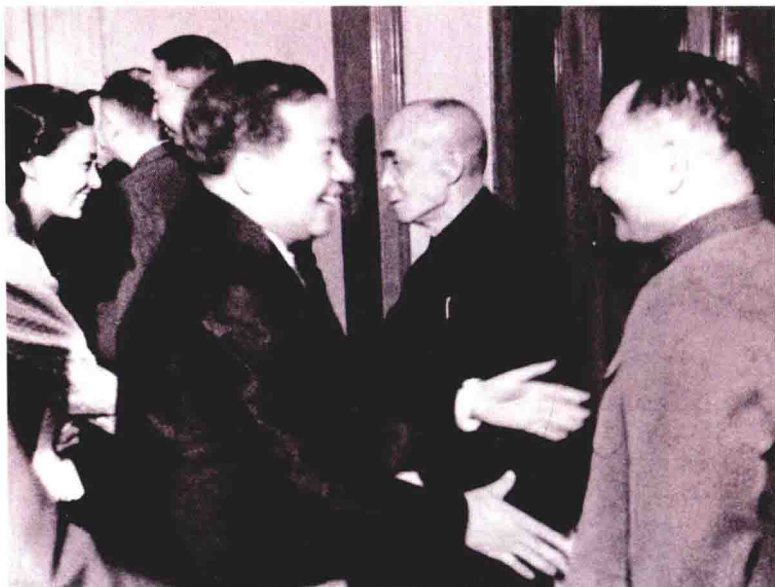
1973年4月12日，邓小平出现在周恩来举行的欢迎柬埔寨西哈努克亲王的宴会上。这是邓小平自1967年销声匿迹后，第一次公开露面。