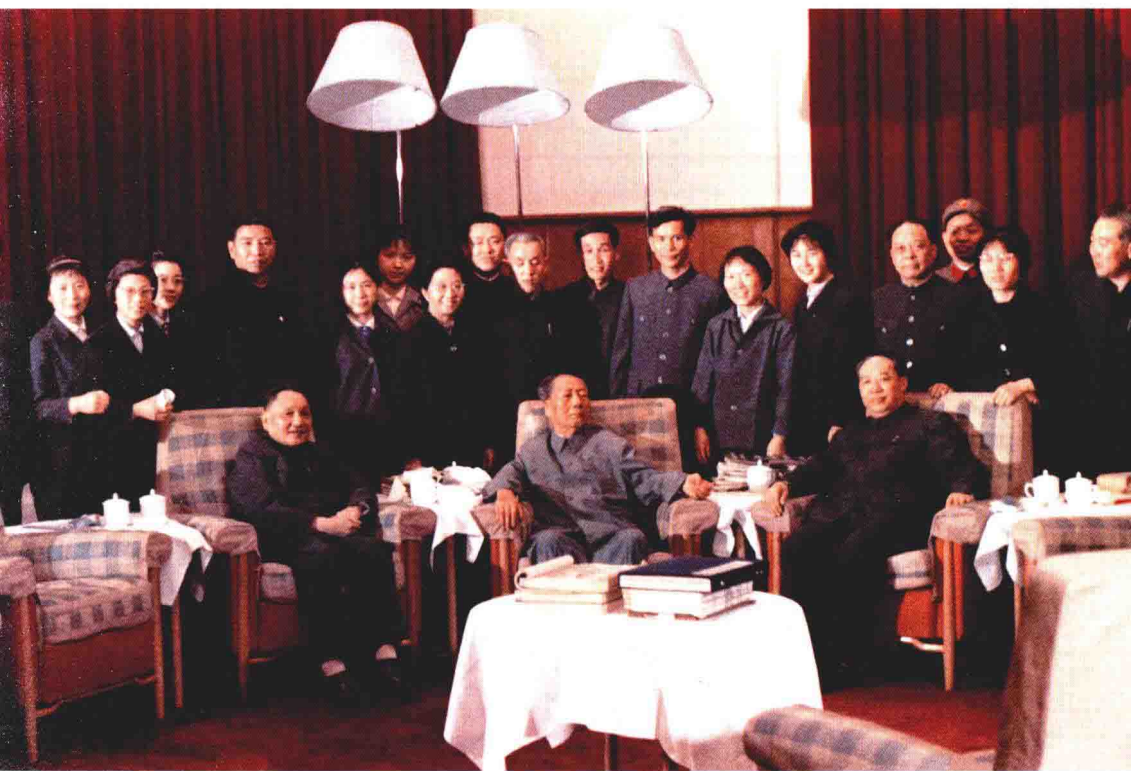
1975年，邓小平等人在毛泽东的客厅里