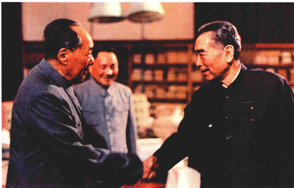
1974年，毛泽东、周恩来、邓小平在北京中南海游泳池客厅亲切交谈