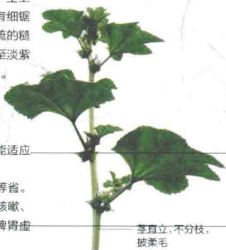
茎直立，不分枝，被柔毛

●饮食宜忌：尤适宜多痰、痰黏稠、肺热咳嗽、咽喉肿痛或热毒下痢患者。冬葵性寒，脾胃虚寒或腹泻者忌食，孕妇慎食。