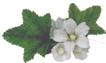
花单生或簇生于叶腋，花瓣5枚，白色