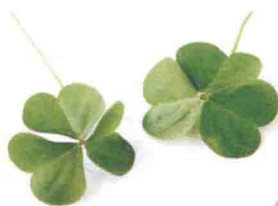
复叶，具3小叶， 扁圆状倒心形