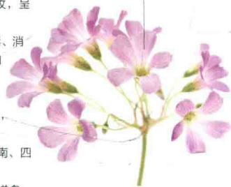
伞形总状花序， 总花梗长

●饮食宜忌：适宜痛经、月经不调、白带增多、砂淋、脱肛或痔疮患者。红花酢浆草性寒，孕妇忌服。