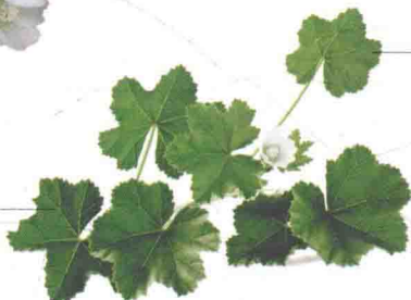
叶圆形，边缘具锯齿