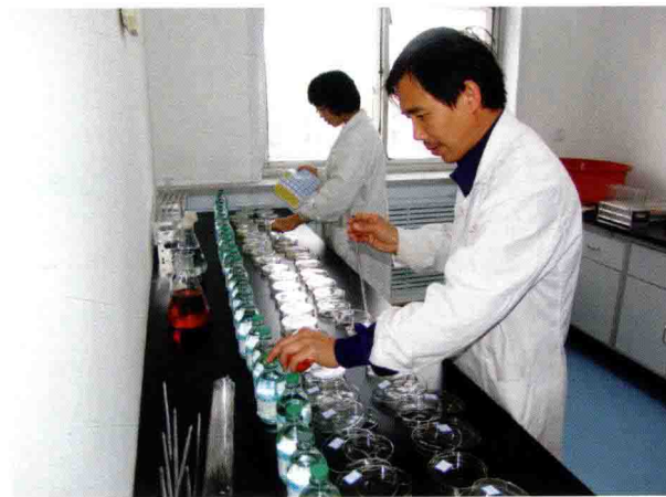
水质化验室同志在进行水样分析(2011)