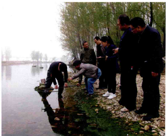
流量施测(原载 2014 年 4 月 24 日《中国水利报》)