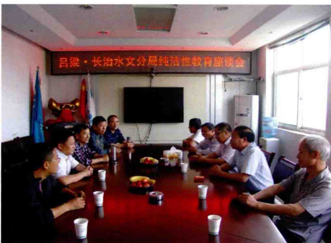
与吕梁分局座谈纯洁性教育(2012)