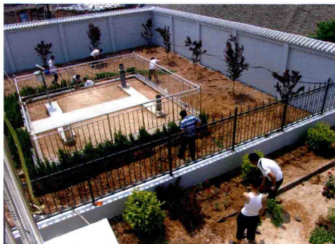
分局干部职工为标准站建设竣工的后湾站进行绿化美化(2012)