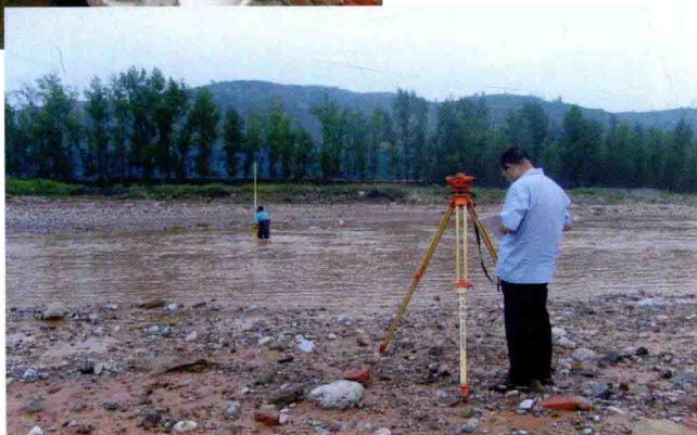
在武乡蟠洪河进行暴雨洪水调查(原载2010年8月15日《长治日报》)