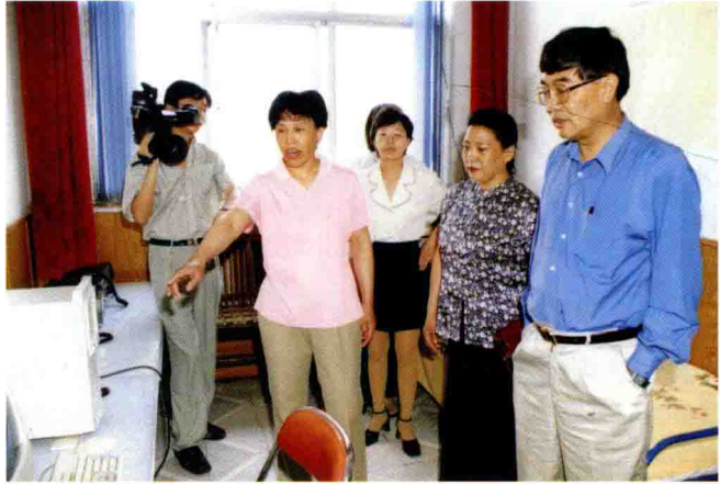
2000年6月6日,时任长治市委书记吕日周在分局水情值班室视察。