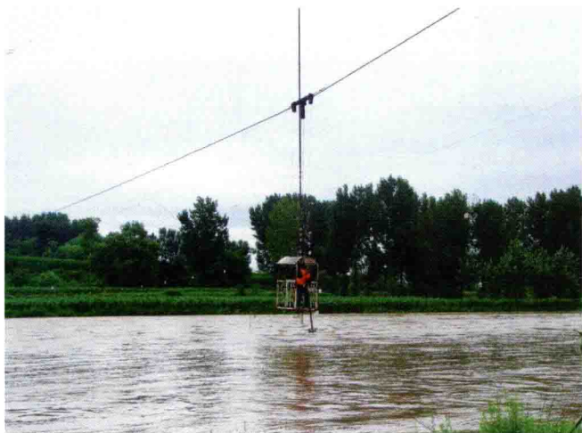
施测流量(原载 2011 年 6 月 29 日《上党晚报》)