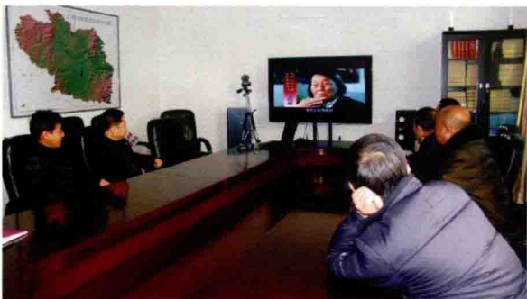
观看专题片《申纪兰》(2011)