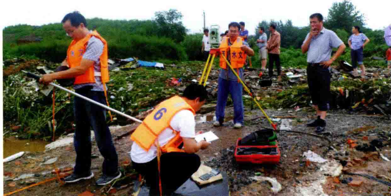
在晋城白水河进行洪水调查(2012)