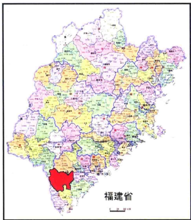
图一 平和县地理位置图

据《平和文史资料》第一辑载，明正德十四年（1519）罗干（江西永丰）为平和第一任知县，至崇祯二年（1629）袁国衡，共有13位江西籍人担任平和知县，主政共计52年。历任江西籍平和知县，为造福桑梓，发展地方经济，利用瓷器是外销的重要商品，又