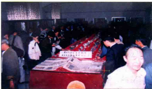
图三 中国古陶瓷学会漳州年会参观平和“漳州窑”文物

1999年10月，中国古陶瓷研究会1999年会在漳州市举行（图三），来自加拿大、日本、菲律宾、台湾、香港等7个国家和地区的专家学者300多人参加会议。本届年会以漳州（平和窑）为研讨主题，与会专家、代表专程考察了平和洞口窑、大垵窑、二垵窑现场，进一步提高了平和窑在该研究领域的国际地位。