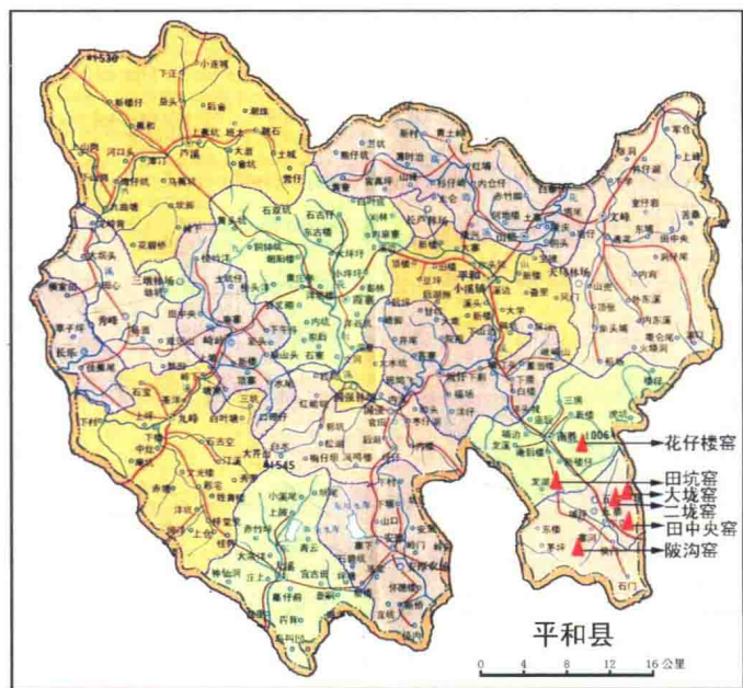
图二 平和县行政区划图

恰逢景德镇外销瓷生产的减产、停产，以及漳州月港海上贸易十分繁荣的有利时机，便鼓励和组织发动群众，生产国外市场需求的瓷器产品。