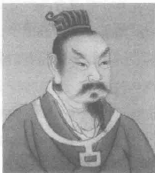
后梁建立者朱温像

所谓十国，则是在秦岭—淮河以南，先后同五代并存、对峙的十个割据王国，其方位大致是沿长江流域自西向东排列为：前蜀（公元903～925年，都成都府，共2帝）与后蜀（公元934～965年，都成都府，共2帝）、荆南（公元924～963年，都江陵府，共5主）、楚（公元897～951年，都潭州长沙府，共6王）、吴（公元902～937年，都扬州江都府，共4主）与南唐（公元937～975年，都升州金陵府，共3帝）、吴越（公元907～978年，都杭州钱塘府，共5王）、闽（公元909～945年，都福州长乐府，共6主）、南汉（公元917～971年，都广州兴王府，共4帝），再加上黄河以东至太原府以北的北汉（公元951～979年，都太原府，