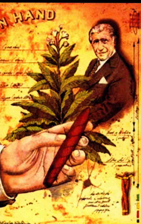
千里系列 (Davidoff Mille)

大卫杜夫千里系列顺滑芳香的口感是这款雪茄最吸引人的地方，口味介于浓烈突出的顶级系列及温和精巧的古典系列之间。此款雪茄的茄衣均选用世界顶级康涅狄格遮叶，茄套和茄芯都产自于多米尼加共和国。