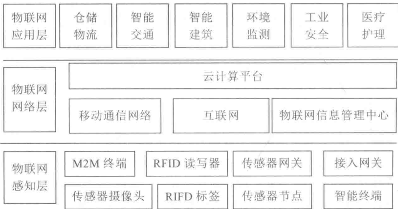
图 1-2 物联网体系架构

应用层也可称为处理层，解决的是信息处理和人机界面的问题。网络层传输而来的数据在这一层里进入各类信息系统进行处理，并通过各种设备与人进行交互。处理层由业务支撑平台(中间件平台)、网络管理平台(例如 M2M 管理平台)、信息处理平台、信息安全平台、服务支撑平台等组成，完成协同、管理、计算、存储、分析、挖掘以及提供面向行业和大众用户的服务等功能，典型技术包括中间件技术、虚拟技术、高可信技术、云计算服务模式、SOA 系统架构方法等先进技术和模式可被广泛采用，如图 1-2 所示。